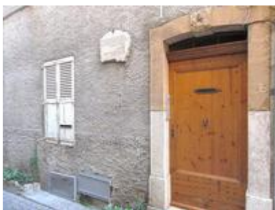
Maison natale de Jacques Audiberti, rue du saint Esprit, Antibes