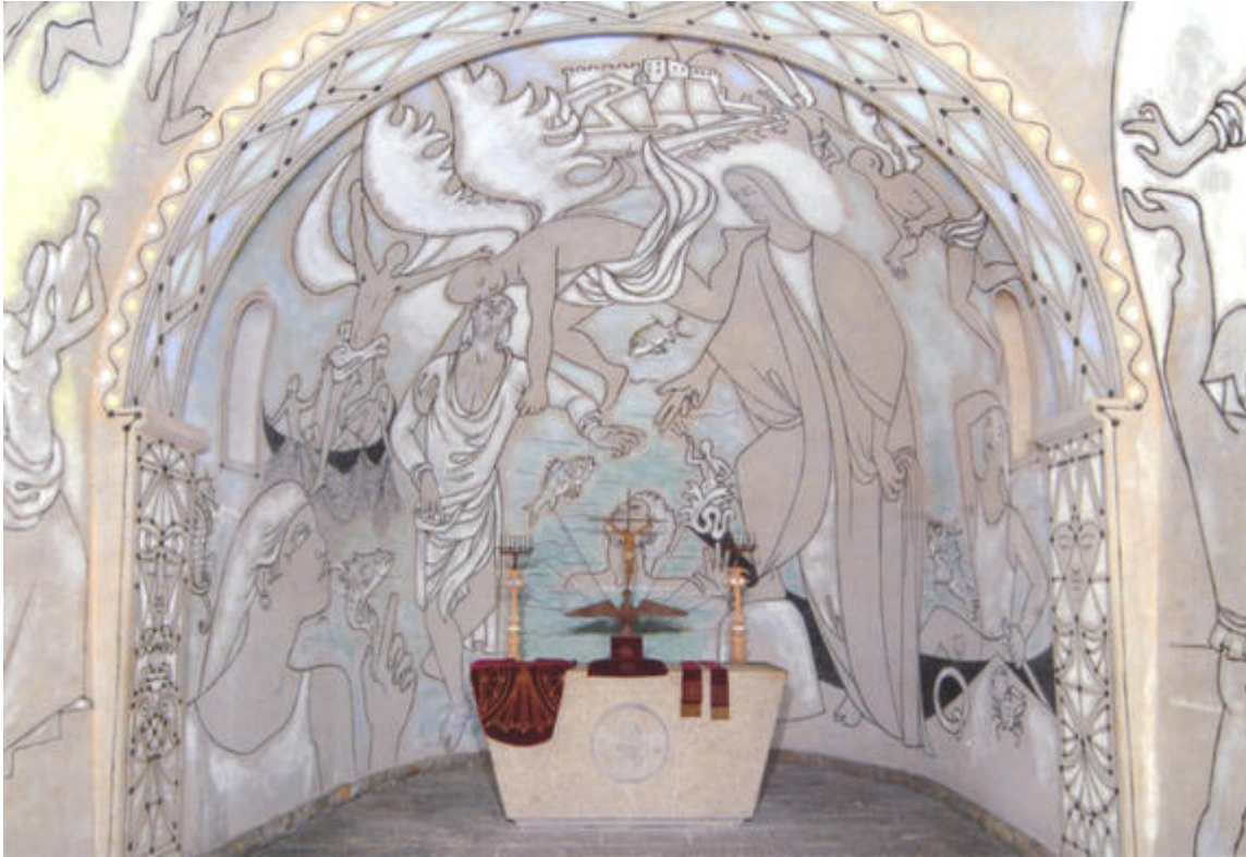
Vue d'ensemble de l' abside et du chœur « Pierre marchant sur les eaux », Chapelle Saint-Pierre, Villefranche-sur-Mer

L'art sacré est l'art commandé par l'Église catholique, qu'on peut aussi bien nommer "l'art d'église". Le renouveau de l'art religieux catholique qui suit en France la Seconde Guerre mondiale correspond aux grands chantiers de la reconstruction ainsi qu'à un désir de réconciliation entre l'Église et l'art moderne.