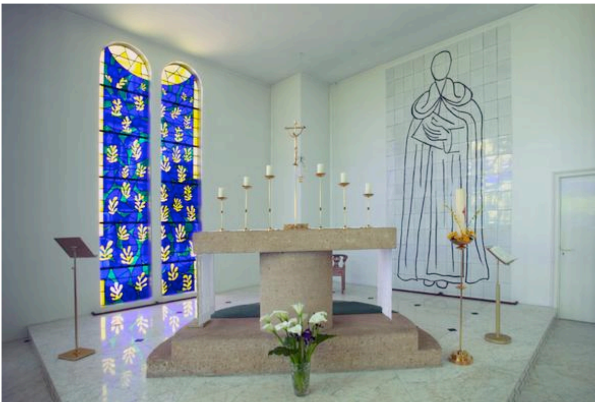
Le chœur de la chapelle du Rosaire à Vence ; l' autel , les vitraux, les céramiques et objets liturgiques d'Henri Matisse.