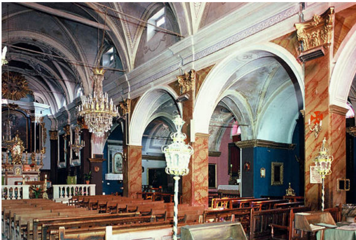
Vue du chœur et des nefs latérales