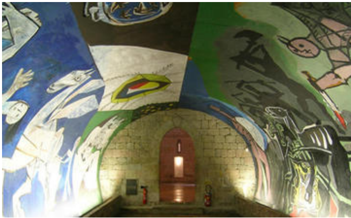
La guerre et la paix, décors de la chapelle du musée de Vallauris, Picasso © Succession Picasso 2020