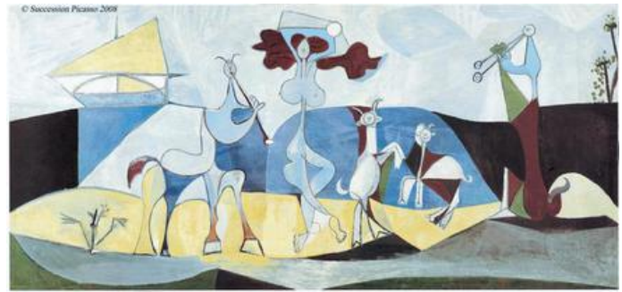
La joie de vivre, Pablo Picasso, 1946 © Succession Picasso 2020 © Musée Picasso, Antibes