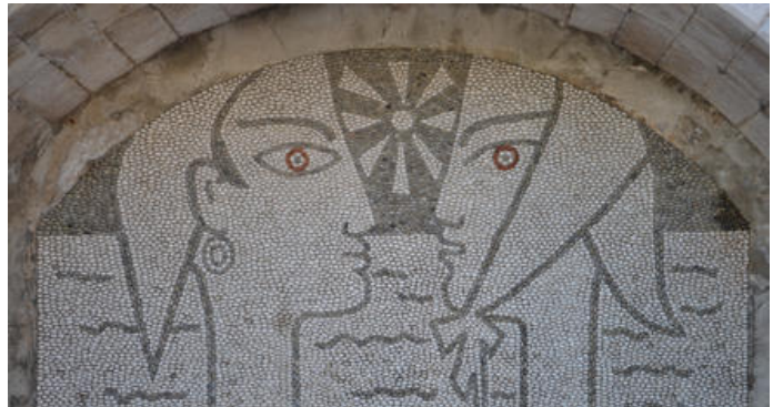
Mosaïque de galets conçue par Jean Cocteau, Musée du Bastion à Menton