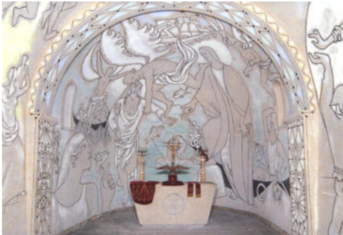
Pierre marchant sur les eaux, fresque de Jean Cocteau