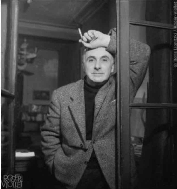
Portrait de Francis Ponge, 1954

Né en 1899 à Montpellier, Francis Ponge est un des plus grands poètes du XX e siècle. Dès 1923, il décide de se consacrer à l'écriture mais sa renommée commence avec la publication en 1942 de Le parti pris des choses . La reconnaissance du milieu littéraire français n'arrive que dans les années 1980. Installé au Bar-sur-Loup en 1961, il y est décédé en 1988. Un fonds de 143 livres de Francis Ponge a été offert par sa fille à la bibliothèque communale de Bar-sur-Loup.