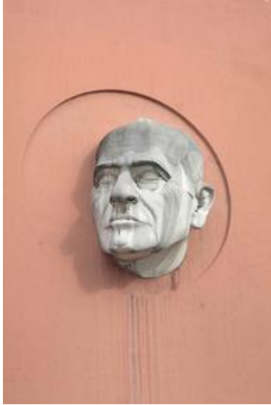
Sculpture ornant le lycée Jacques Audiberti, Antibes

« Pierres d'Antibes... Antipolis ... ville contraire... ville depierre – ville du Rempart, de Septentrion, du Marbre d'Aphrodite, du Port, du sable, du carré des Tours, du Format romain, du Cimetière répandu, du poilu de Pierre et de la table de Roch, je suis ton fils »