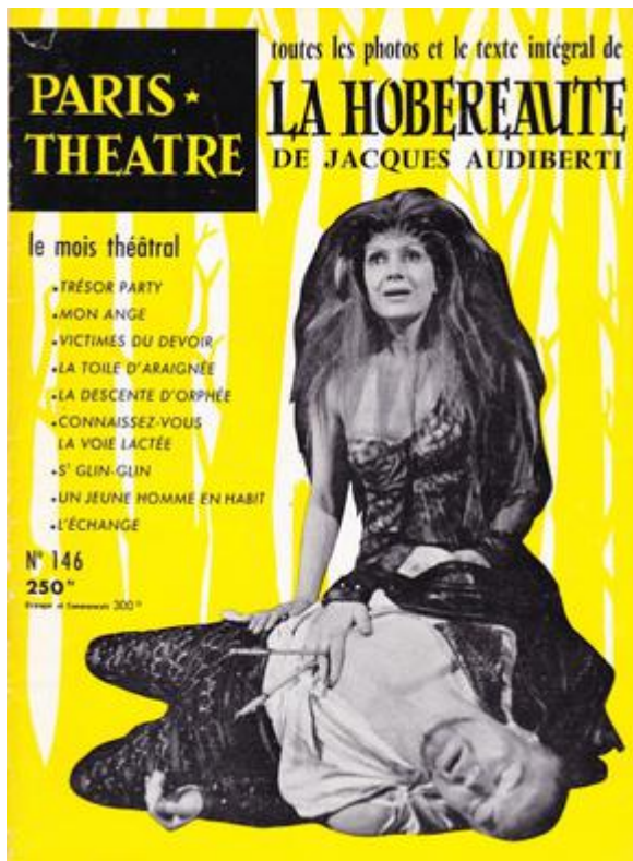
Couverture de la revue Paris Théâtre , 1958