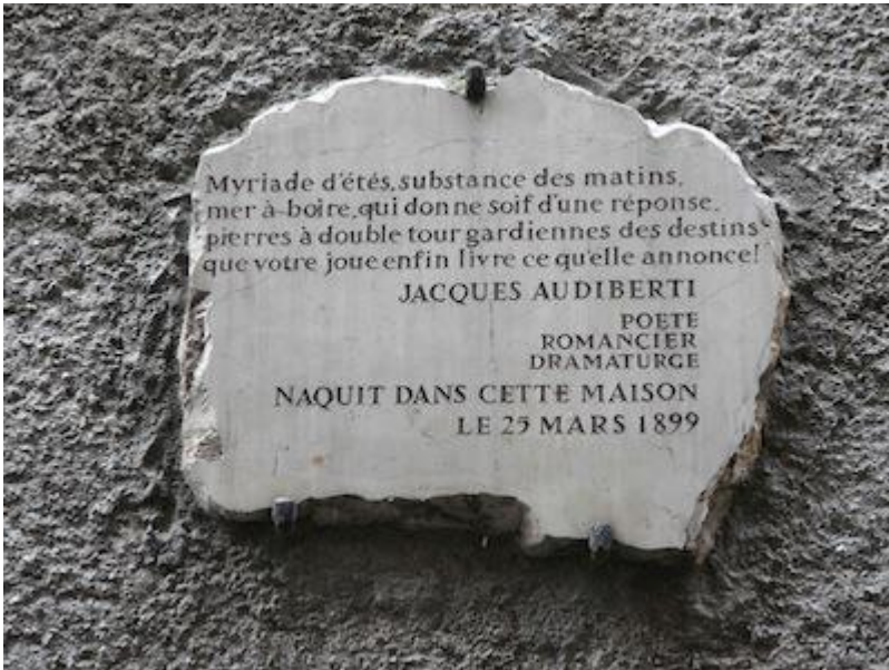
Plaque commémorative sur la maison natale de Jacques Audiberti, Antibes