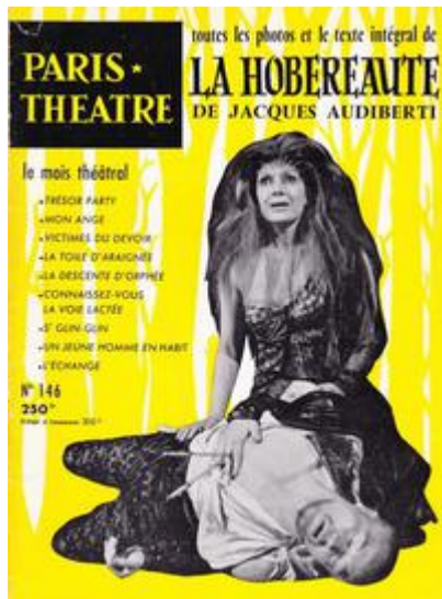
Couverture de la revue Paris Théâtre , 1958

Bien décidé de rompre avec le milieu du journalisme qu'il associe aux périodes difficiles, Jacques Audiberti se consacre entièrement à l'écriture. Les années d'après guerre sont les plus fécondes. En plus des pièces de théâtres et de la peinture qui l'accapare, il écrit un roman par an. L'écriture devient une frénésie, un état second. En parlant de sa pièce de théâtre Le Mal Court (1956), Audiberti écrit : « J'ai écrit en état de transe, comme si Le Mal Court avait été écrit quelque part dans l'espace et que je n'eusse qu'à recopier ce qui était devant moi et au delà de moi. J'ai dû l'écrire en deux heures ... ».