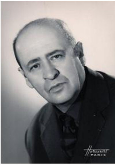
Portrait de Jacques Audiberti