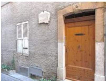
Maison natale de Jacques Audiberti, rue du saint Esprit, Antibes