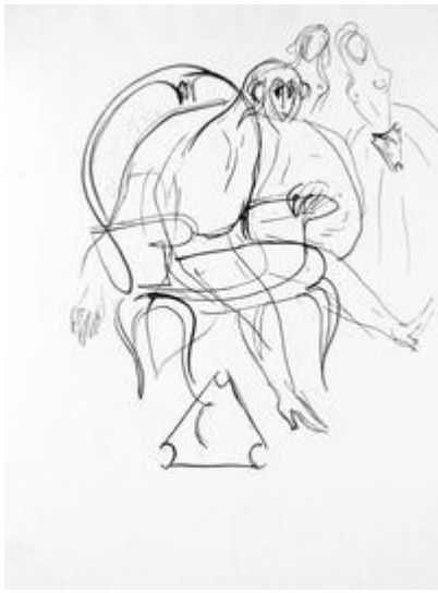
Dessin de Jacques Audiberti