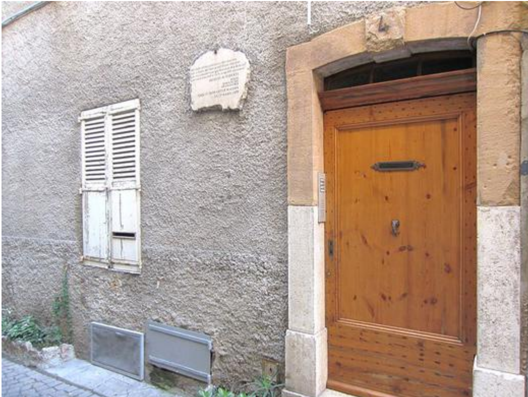
Maison natale de Jacques Audiberti, rue du saint Esprit, Antibes