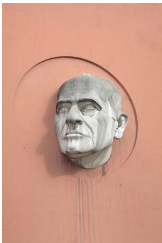
Sculpture ornant le lycée Jacques Audiberti, Antibes