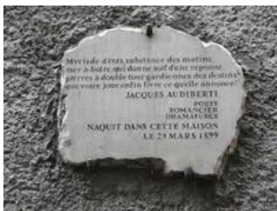
Plaque commémorative sur la maison natale de Jacques Audiberti, Antibes

Avec sa pièce Le mal court , Jacques Audiberti devient un auteur à succès dont on parle. Commence alors son « calvaire d'homme de théâtre. J'ai compris que j'écrivais pour le théâtre. Je ne pouvais plus me le dissimuler, puisque mes pièces étaient jouées. Au poète s'est enchevêtré le metteur en scène ». Ses pièces sont plus proches de « l'Opéra parlé » que du théâtre classique. « Les formes théâtrales qui ont joué un rôle dans mon œuvre ne sont pas celles du Théâtre, mais celles de l'Opéra et de l'Opéra-Comique », déclare-t-il. « Si on met bout à bout romans, poèmes, et presque toutes mes pièces de théâtre, je crois en effet que c'est le mot "épopée" qui correspondrait à cela, car les thèmes y sont sommaires, peu nombreux, insistants ». Stakanovitch de l'écriture, Audiberti est un écrivain prolifique qui écrit comme il respire : poèmes, pièces, romans, essais, chroniques, traductions, critiques. L'ancien pigiste des chiens écrasés est devenu en quelques années une plume que tous les journaux et toutes les revues s'arrachent : la NRF , La Parisienne , Arts & Spectacles , La Nef ... Le tout jeune critique et futur cinéaste François Truffaut qui l'admire, lui ouvre les colonnes des Cahiers du Cinéma et se lie d'amitié avec lui. Comble du succès, en 1961 son ami et réalisateur Jacques Baratier adapte son roman La Poupée au cinéma.