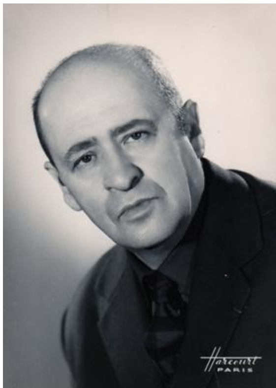
Portrait de Jacques Audiberti