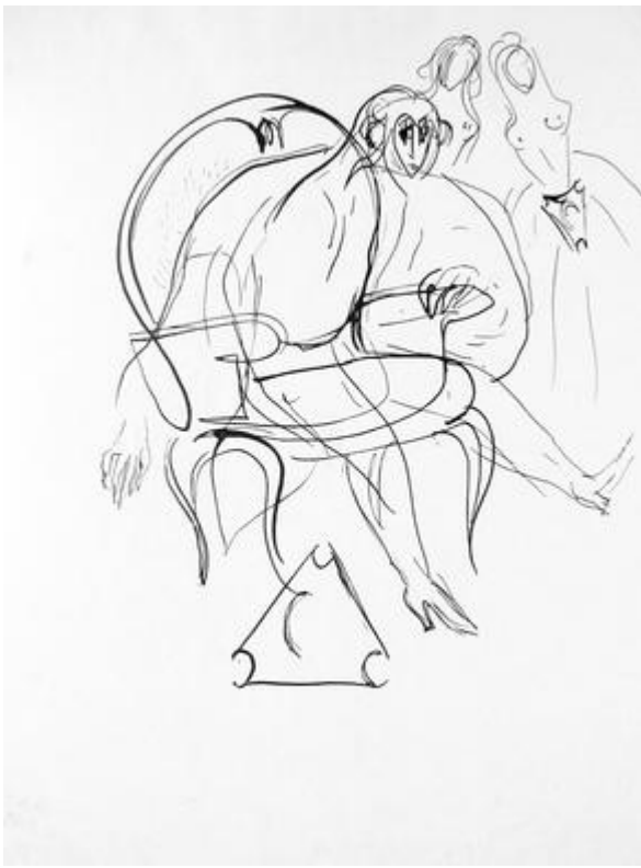
Dessin de Jacques Audiberti