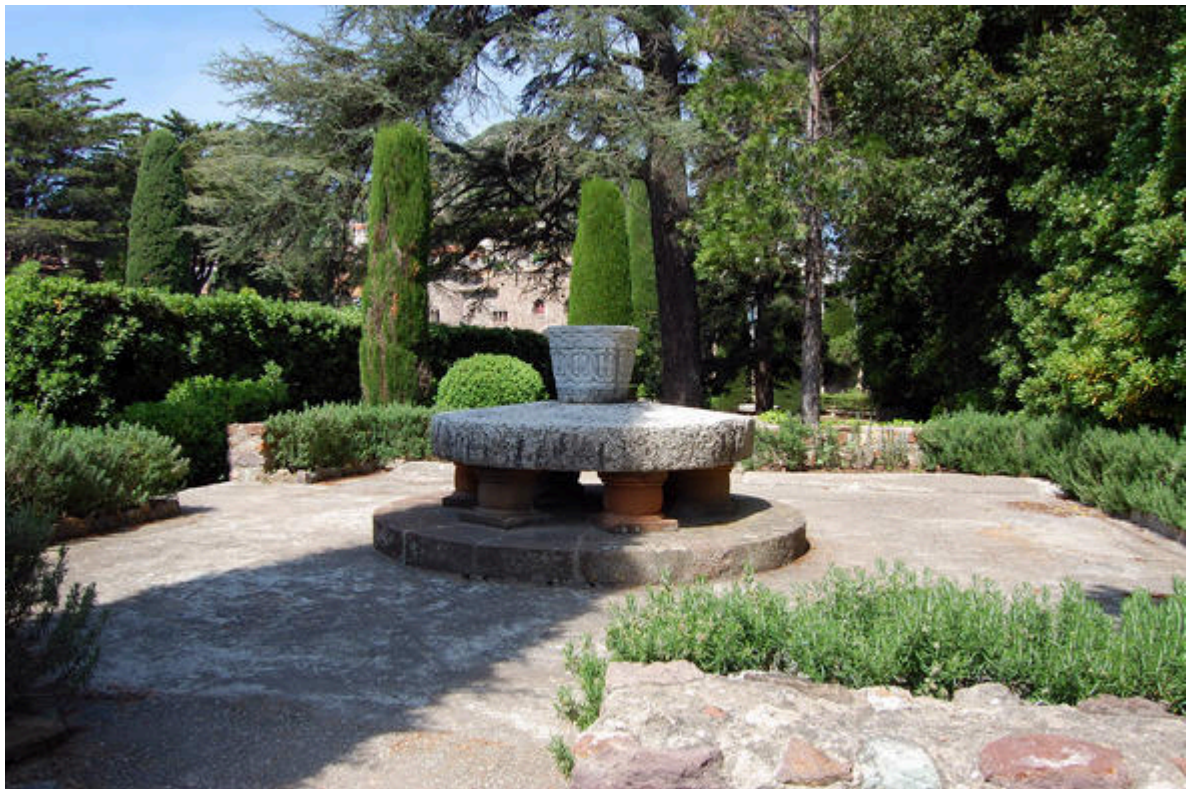
Jardin du château de La Napoule