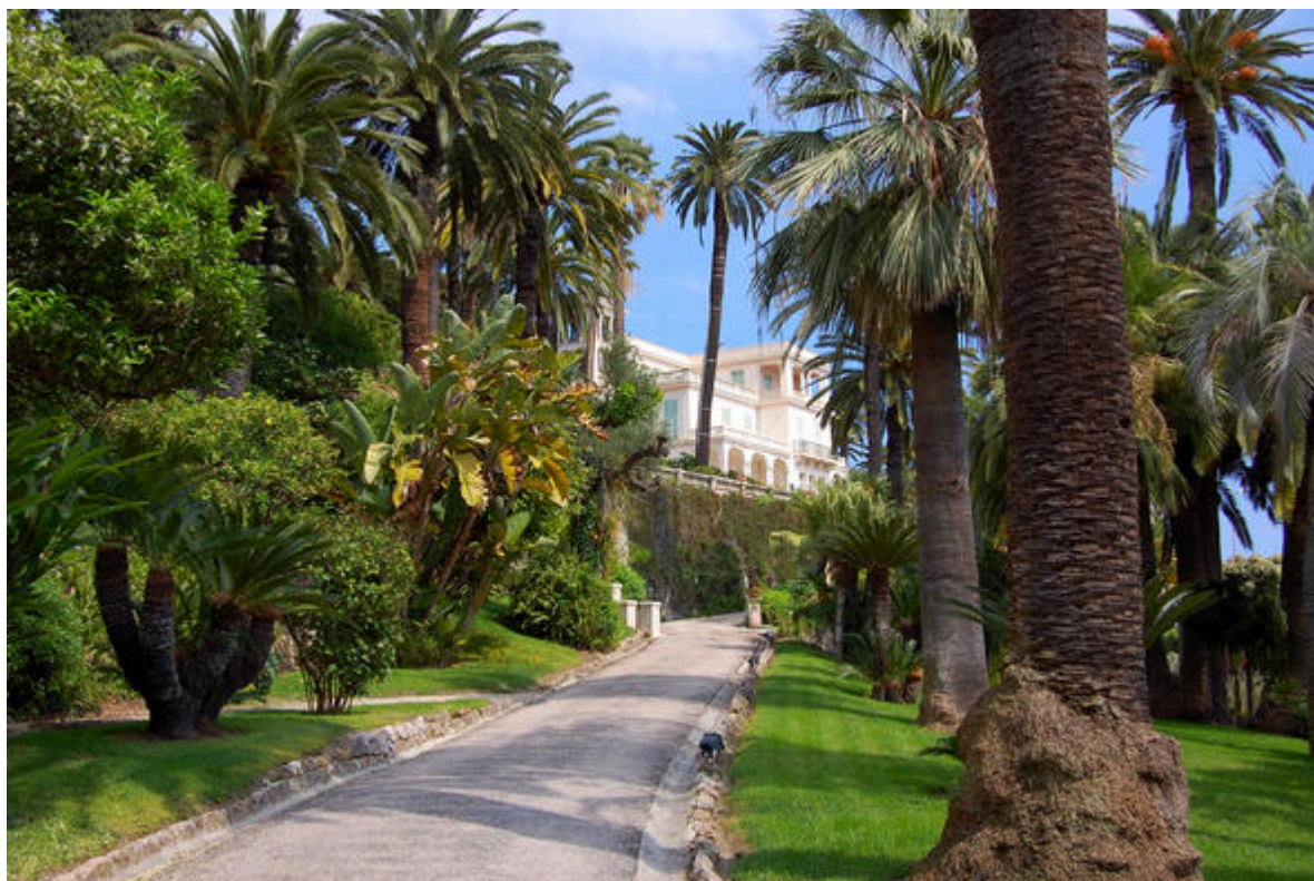
Jardins de la villa Maria Serena à Menton