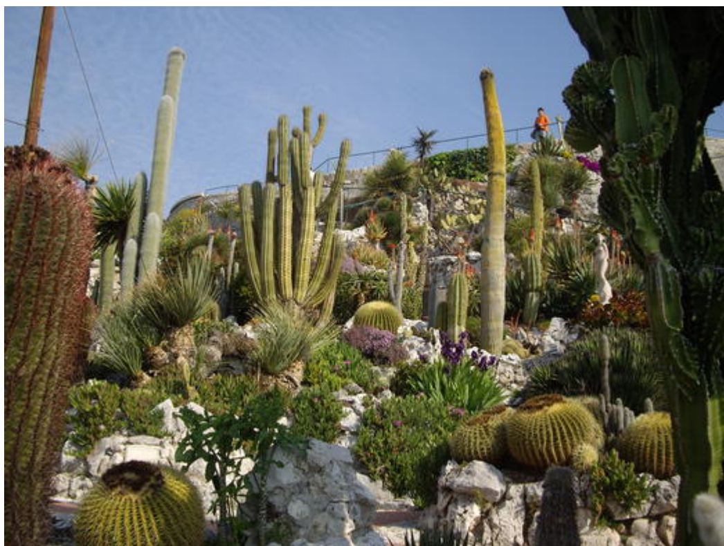
Jardin exotique d'Eze