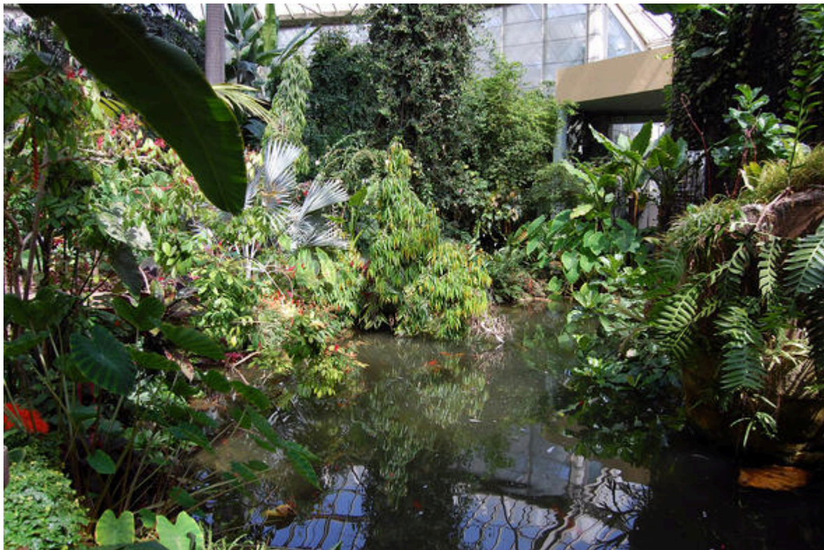
Le diamant vert au Parc Phoenix à Nice