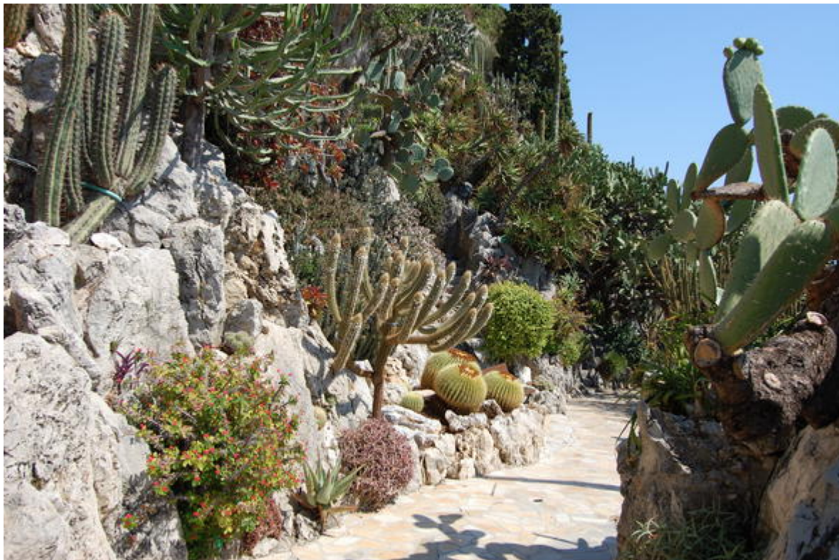
Jardin exotique de Monaco