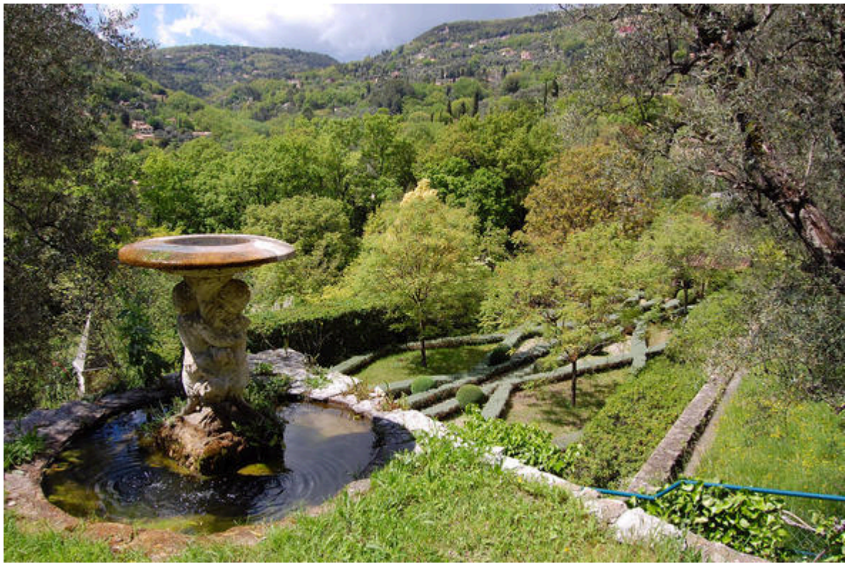
Jardin de la villa Noailles à Grasse