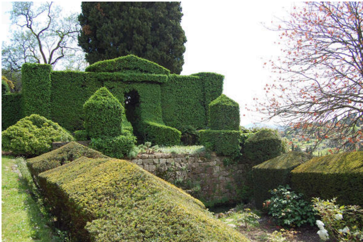
Jardin de la villa Noailles à Grasse