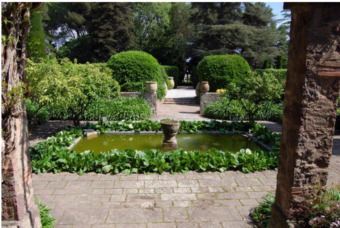
Jardin du château de La Napoule