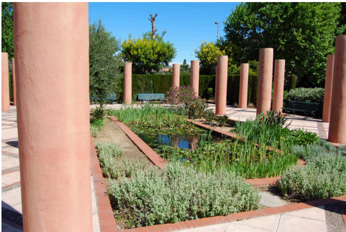
Parc Exflora, le jardin romain, Antibes