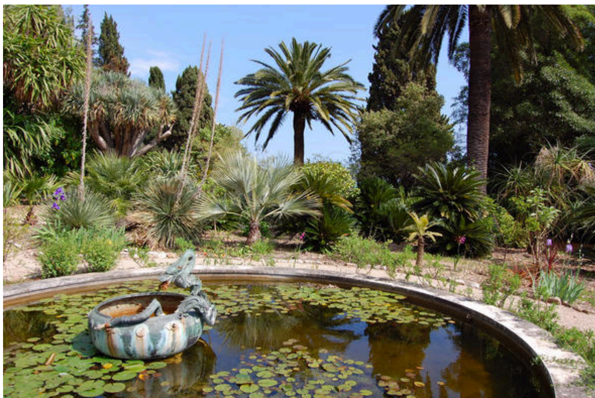
Jardins de la villa Maria Serena à Menton