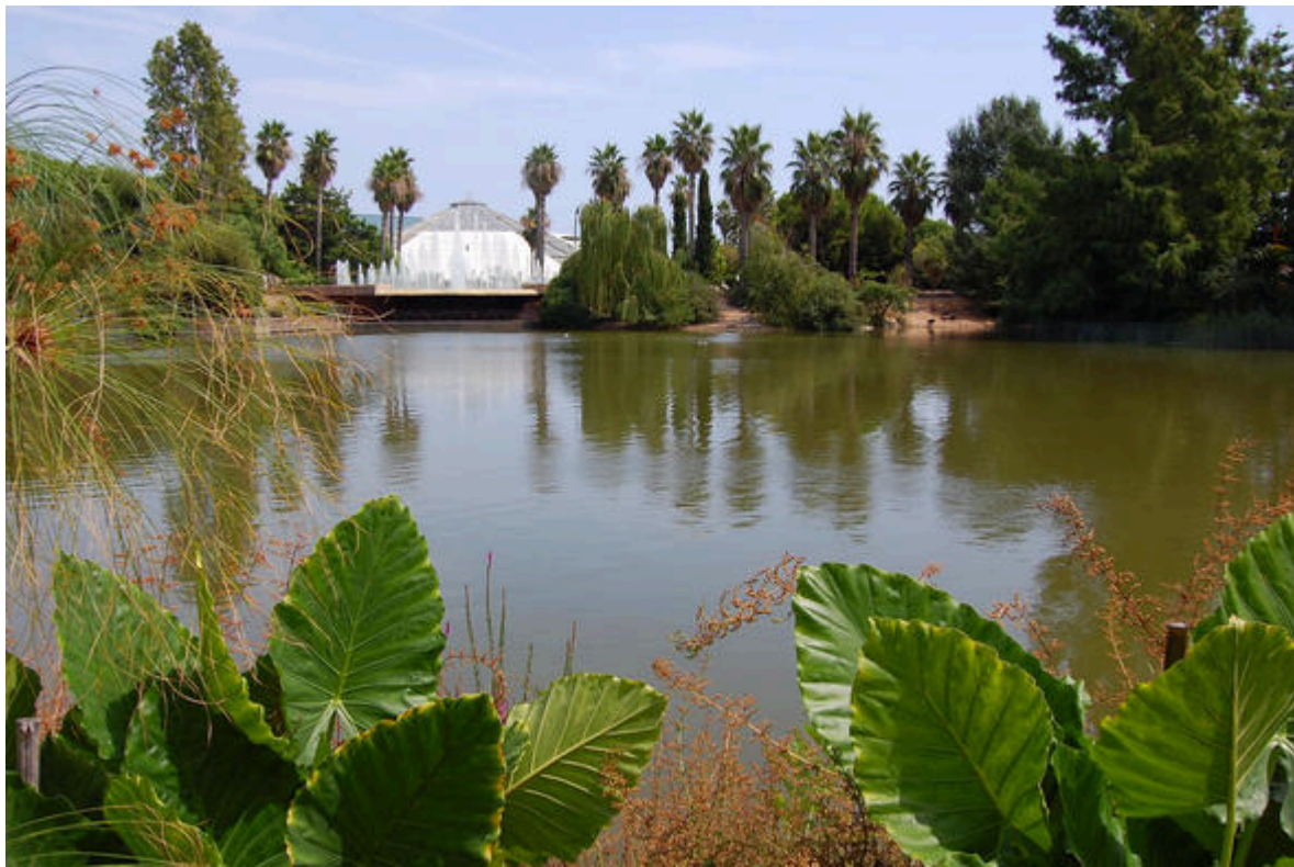
Le diamant vert au Parc Phoenix à Nice