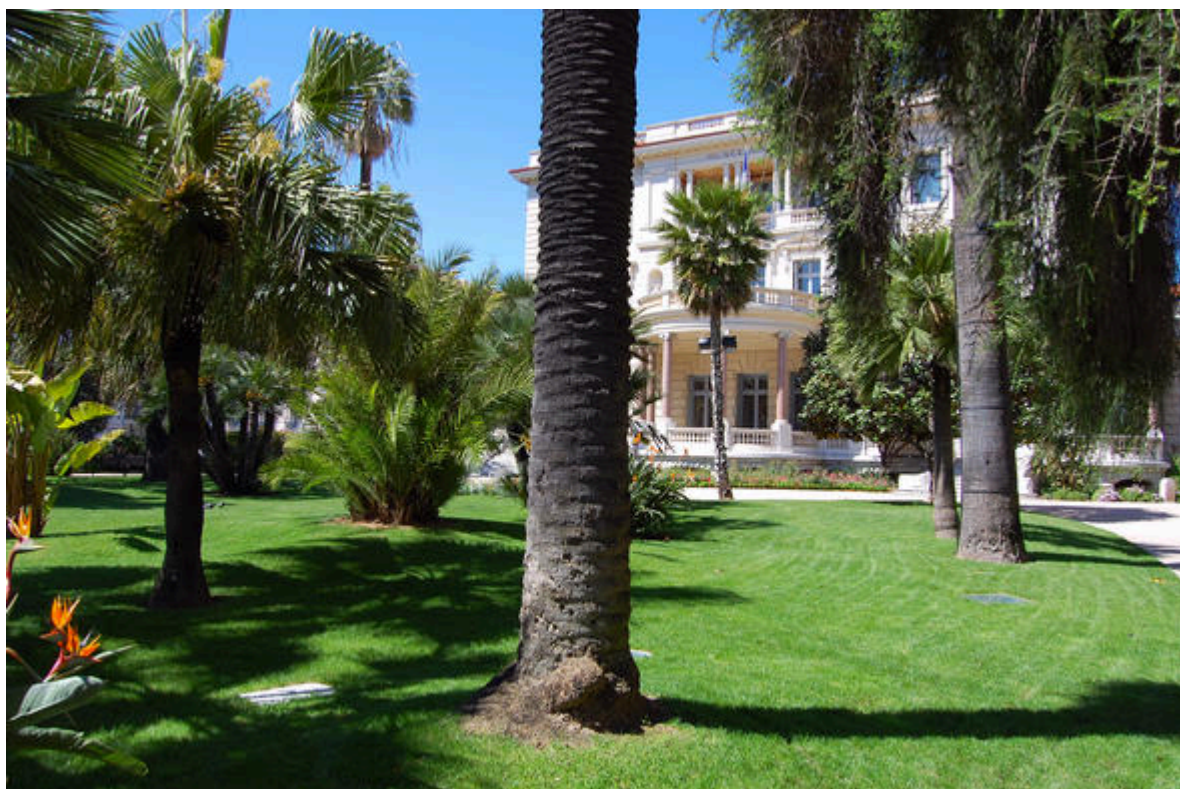
Jardins de la villa Massena à Nice