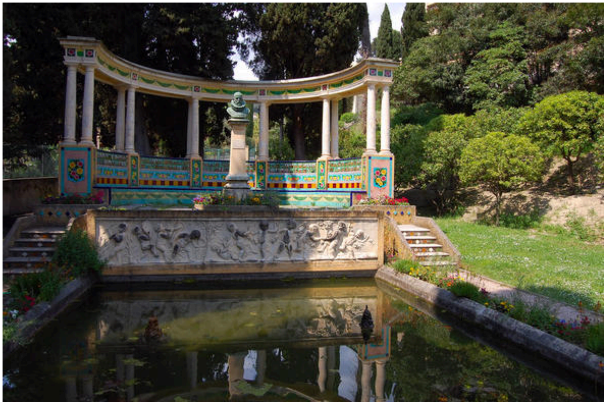
Jardin Fontana Rosa à Menton