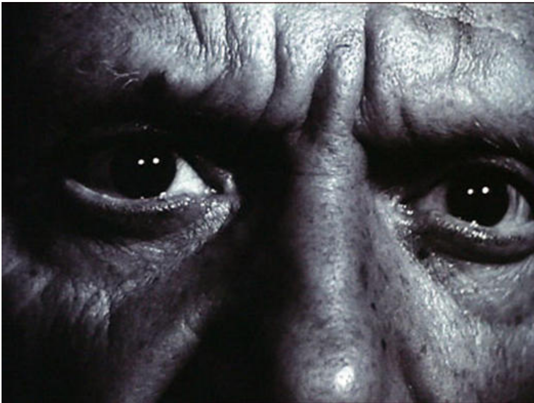
Le mystère Picasso, photogramme © Arte vidéo © Succession Picasso 2020