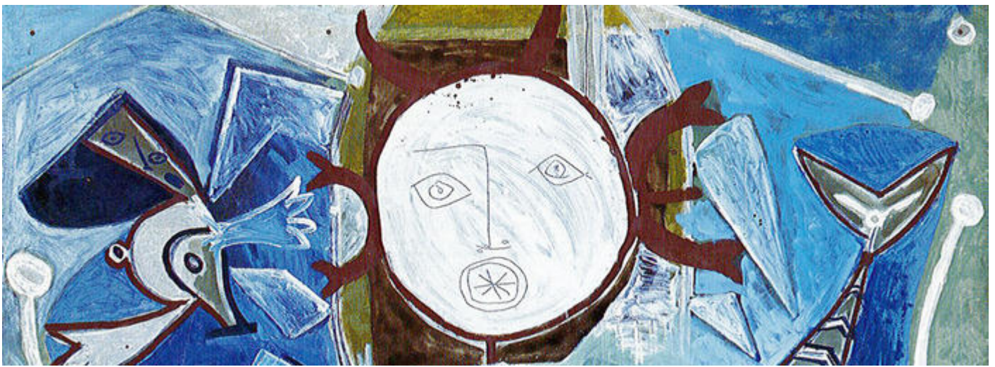
Ulysse et les sirènes, détail, Pablo Picasso © Succession Picasso 2020 © musée Picasso, Antibes