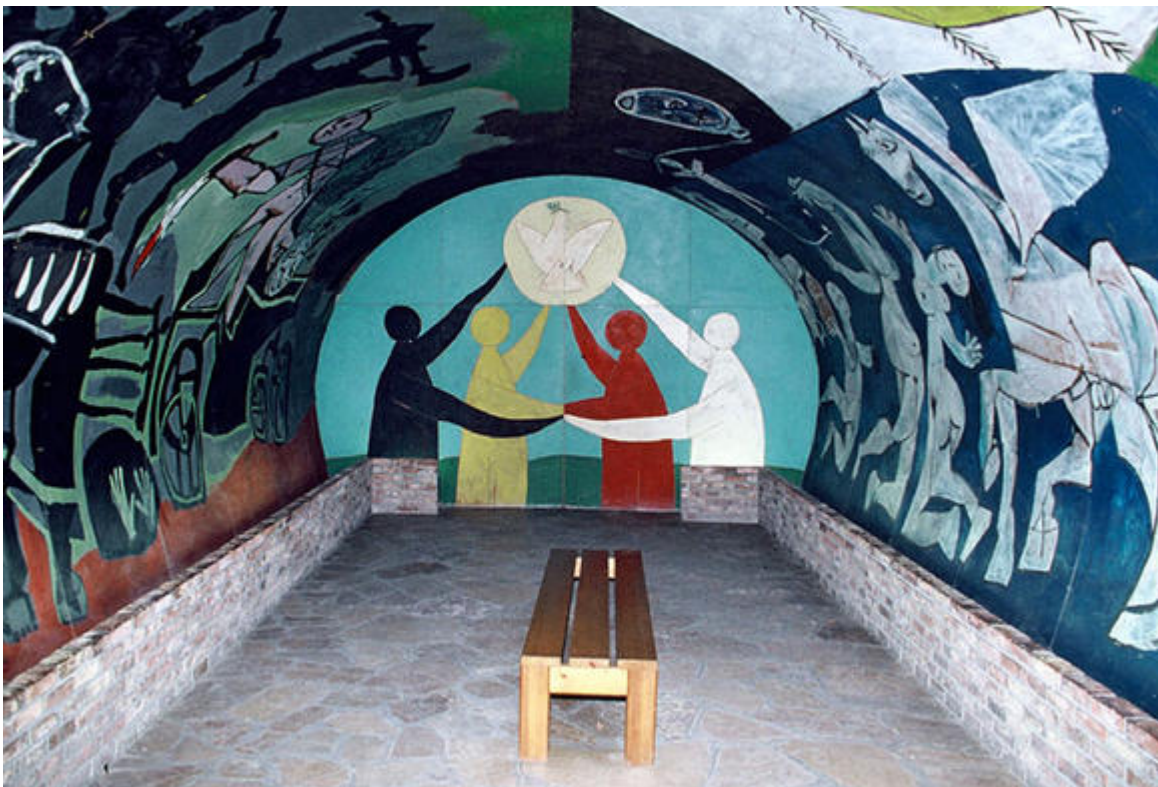
La guerre et la paix, décors de la chapelle du musée de Vallauris, Picasso © Succession Picasso 2020