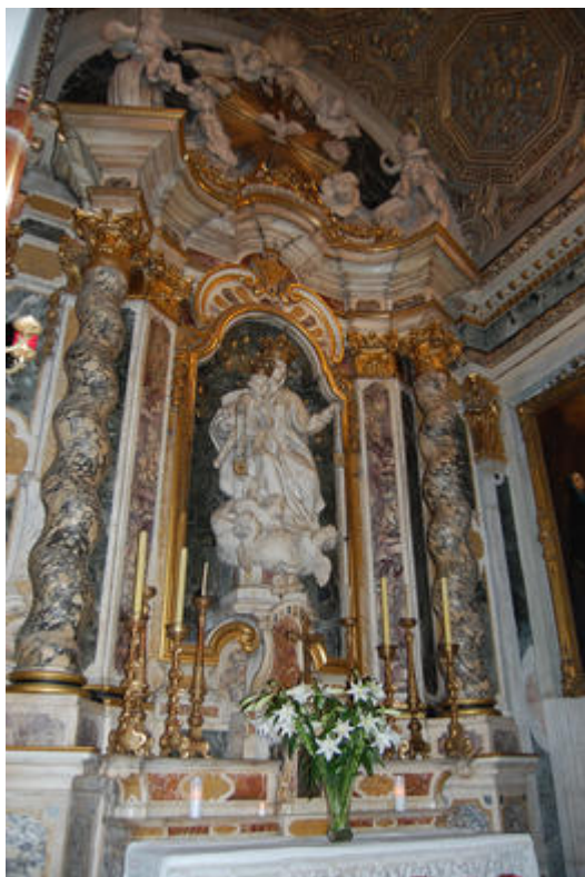
Église de l'Annonciation, chapelle de la Madone du Mont Carmel, Nice