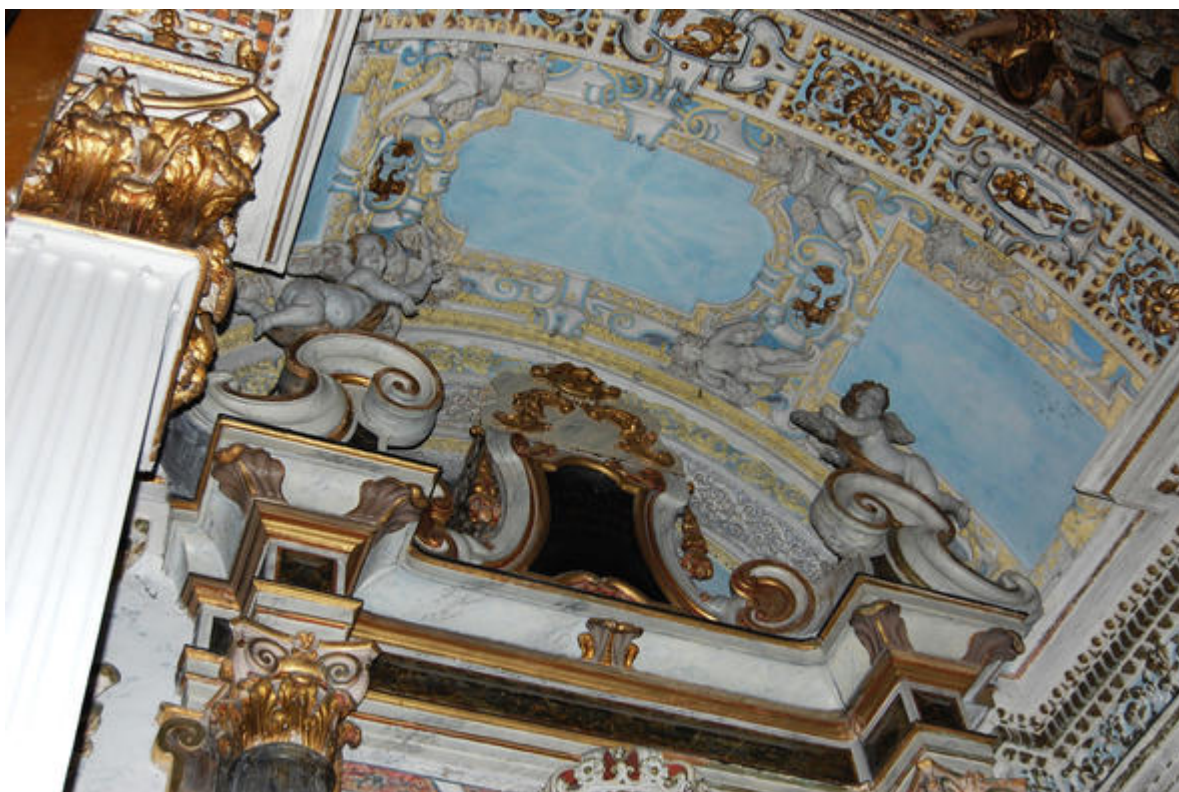
Eglise du Gesu, Nice (la richesse du decor)