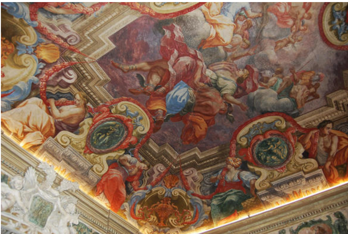
Plafond a ciel ouvert, fresque , Palais Lascaris, Nice (théâtralisation)