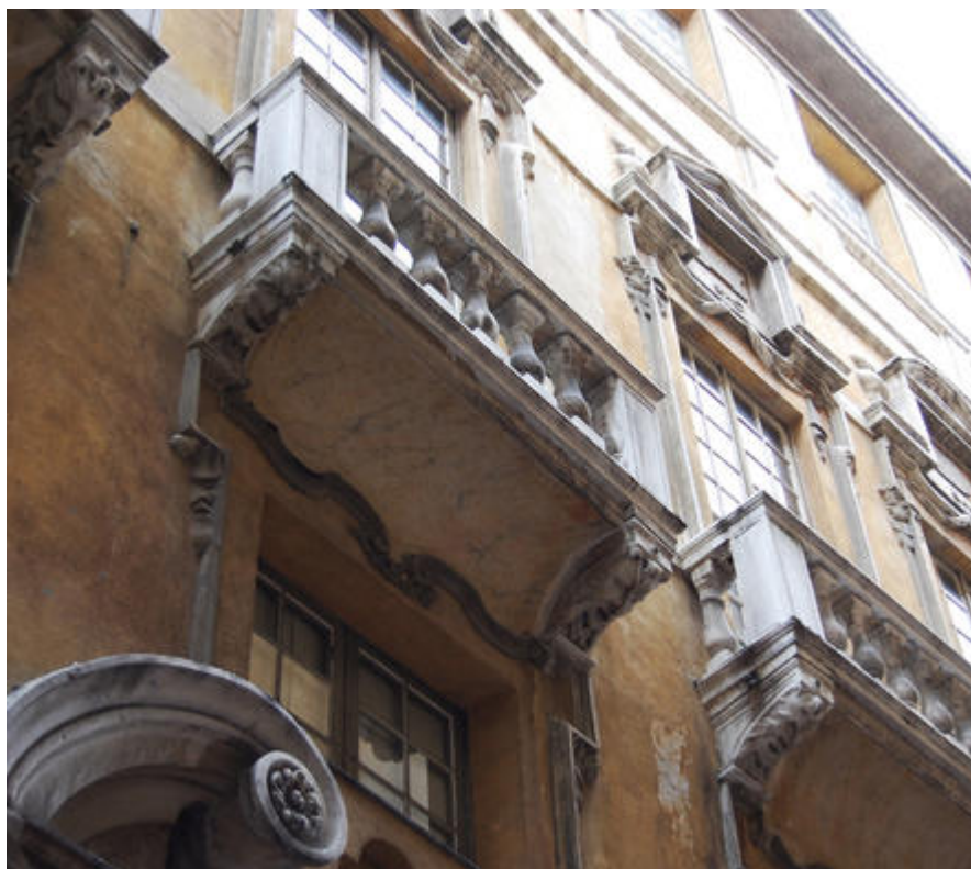
La façade du palais Lascaris, Nice.