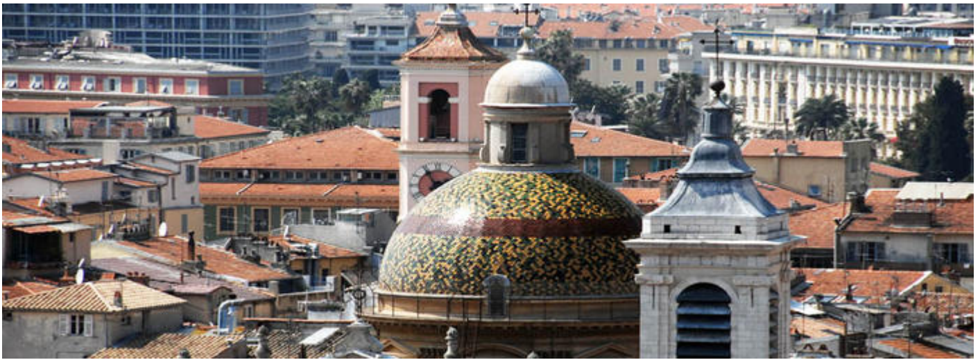
Cathédrale Sainte-Réparate, dôme du XVIIIe siècle, Nice