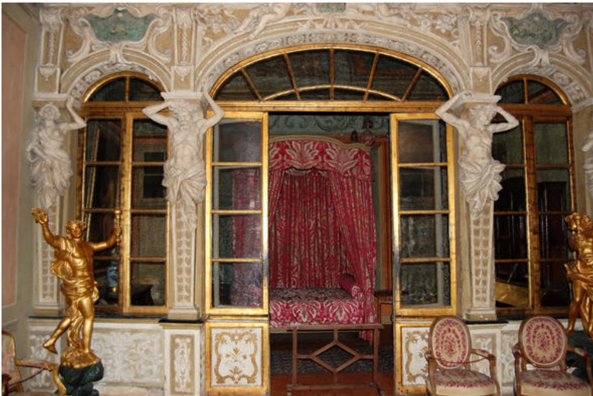
La triple arcade de la chambre d' apparat , Palais Lascaris, Nice (théâtralisation)