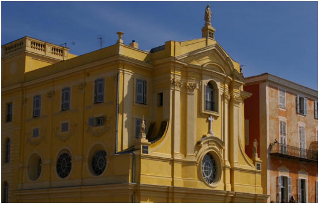
Chapelle de la Miséricorde, Nice