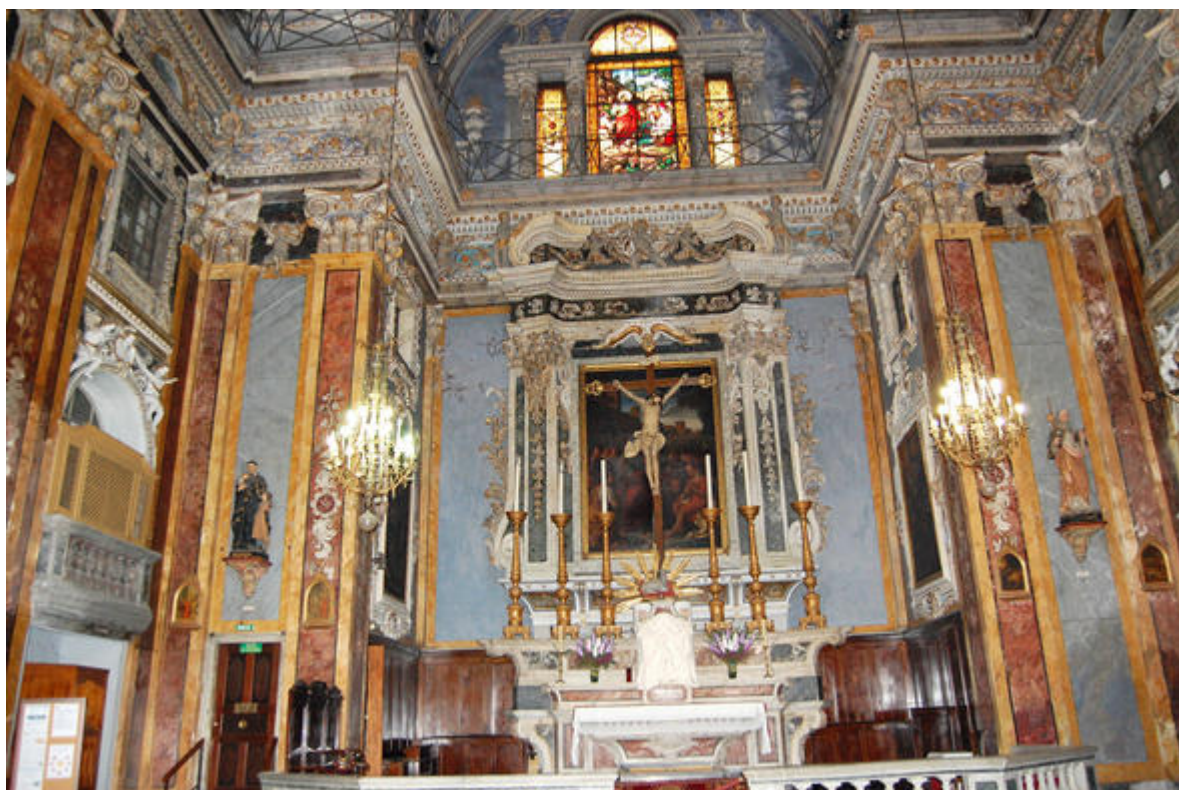
Eglise du Gesu, Nice (la richesse du decor)