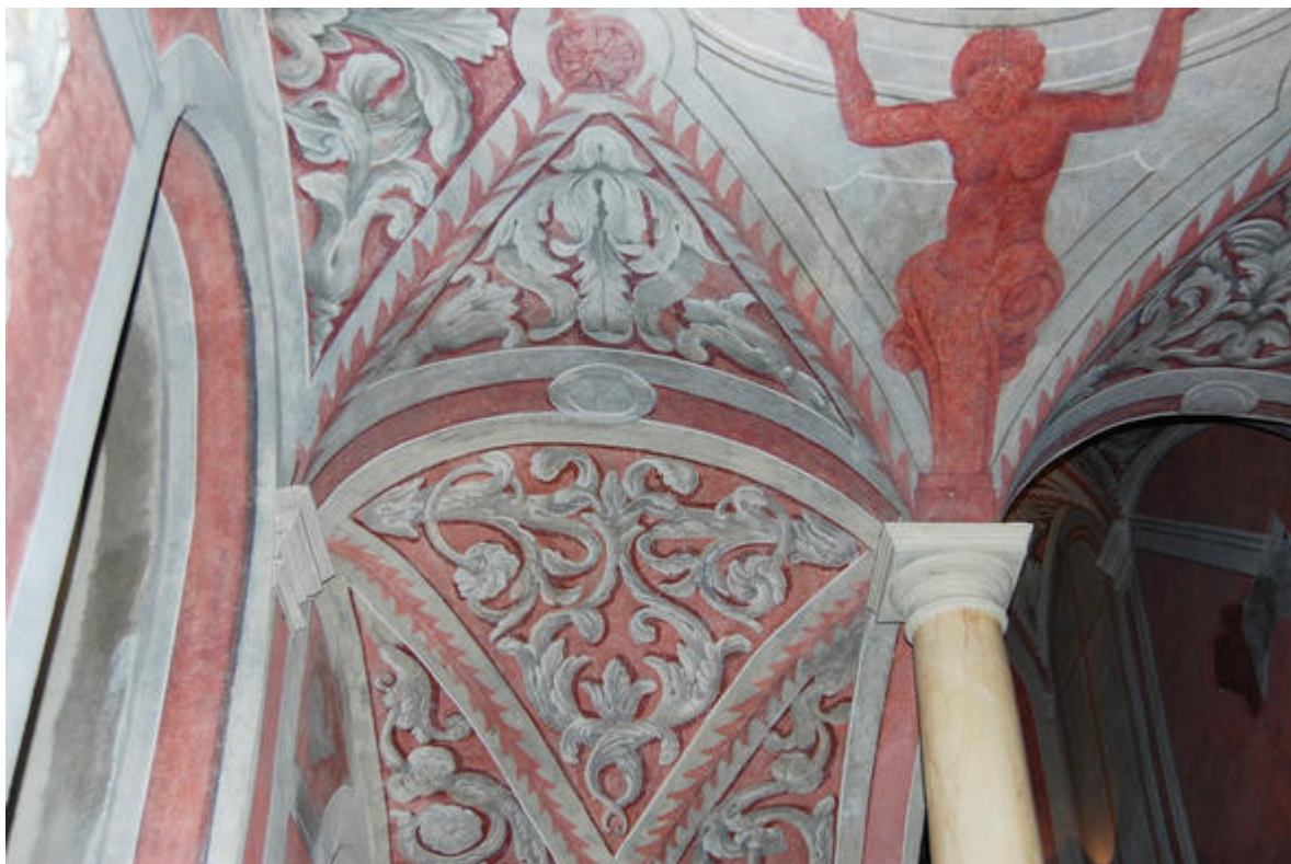
Escalier en trompe-l'œil du palais Lascaris, Nice