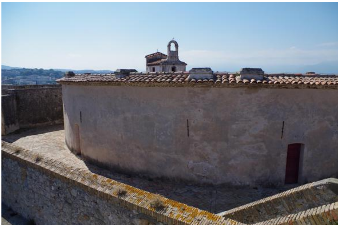
Exterieur de la tour Saint-Laurent