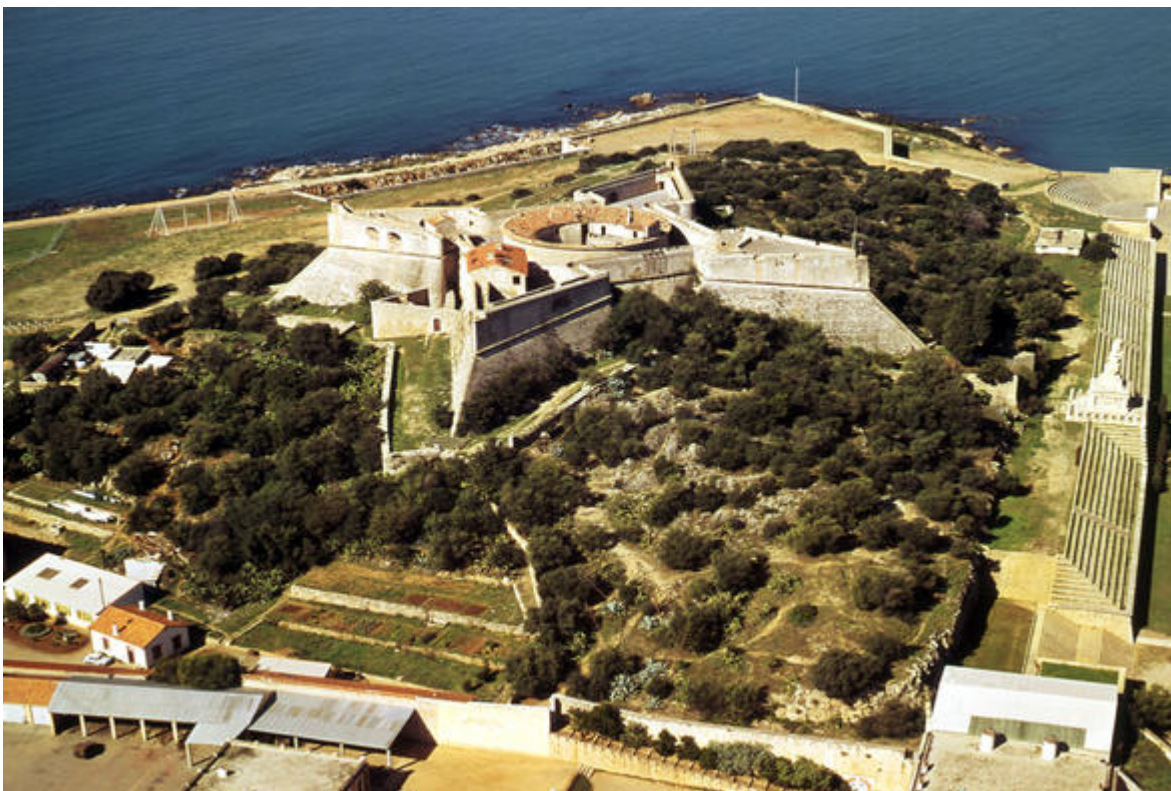
Fort Carré Antibes