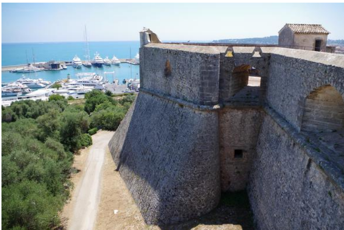
Le bastion Corse