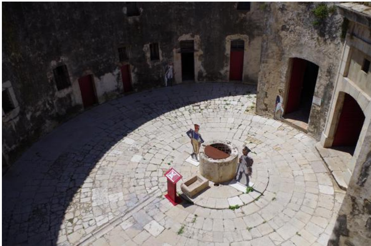
Cour interieure de la tour Saint-Laurent