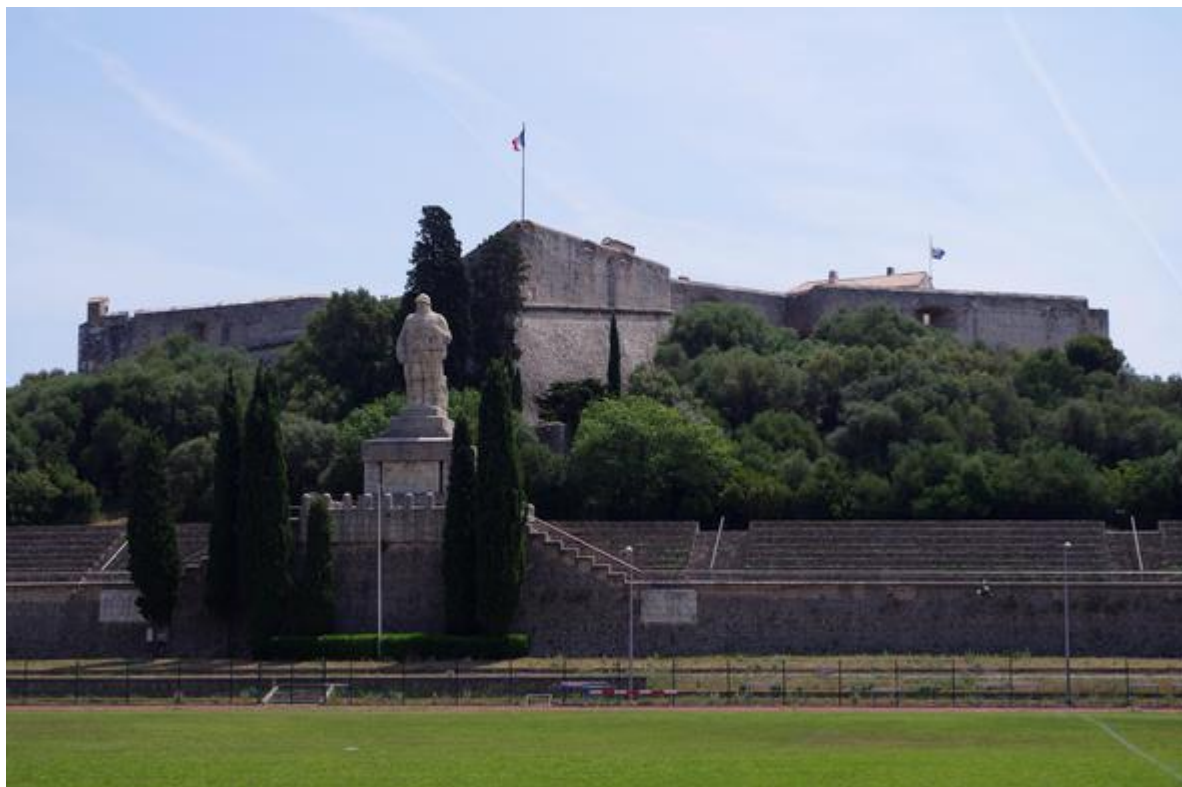
Vue générale du Fort Carré

Le Fort Carré d'Antibes est un ouvrage militaire bastionné du XVI e siècle, l'un des premiers exemples de ce type d'architecture en territoire français. Il faisait partie du système défensif du royaume de France pour la partie orientale de la Provence et a connu plusieurs vies avant de devenir en 1998 un site historique à vocation culturelle ouvert au public.