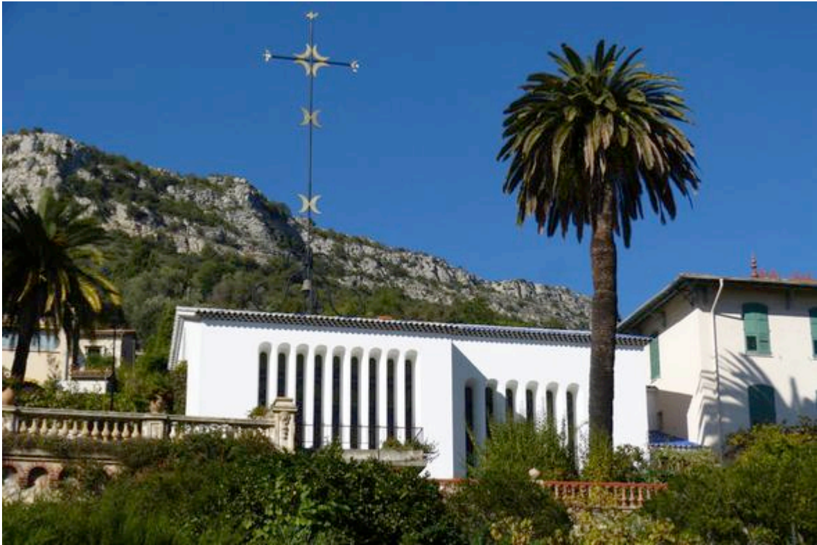
Vue extérieure de la chapelle du Rosaire de Vence

De décembre 1947 à 1951, Henri Matisse élabore, avec l'aide d'Auguste Perret, les plans de la future chapelle du couvent des dominicaines de Vence. Pendant ces quatre années, il travaille à la conception de l'édifice dans sa totalité, jusque dans les