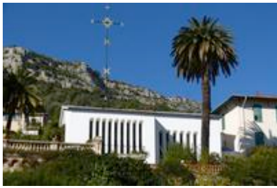
Vue extérieure de la chapelle du Rosaire de Vence