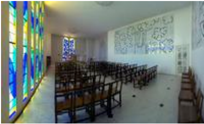
Vue intérieure de la chapelle du Rosaire de Vence

Trois ensembles de céramique blanche décorent les murs de la chapelle : une représentation monumentale de Saint-Dominique , dont l'économie de traits n'ôte rien à l'expressivité ; une Vierge à l'Enfant , pareillement stylisée et entourée de fleurs-nuages et du mot AVE ; un Chemin de Croix , fait, semble-t-il au premier regard, de la combinaison de signes élémentaires.