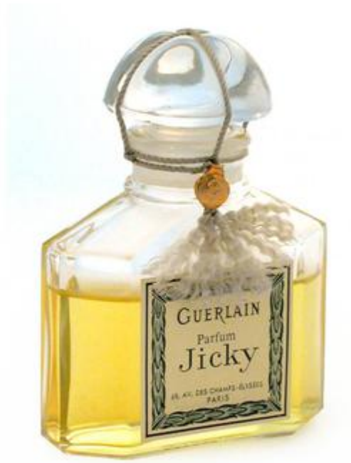
Jicky, créé par Aimé Guerlain en 1889, considéré comme le premier parfum "moderne" ( collection du Musée International de la Parfumerie).