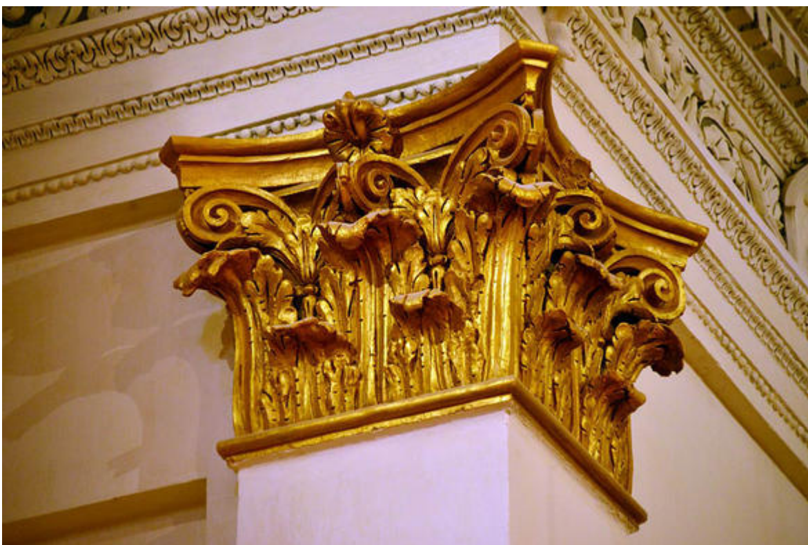
Détail d'un chapiteau de l'église