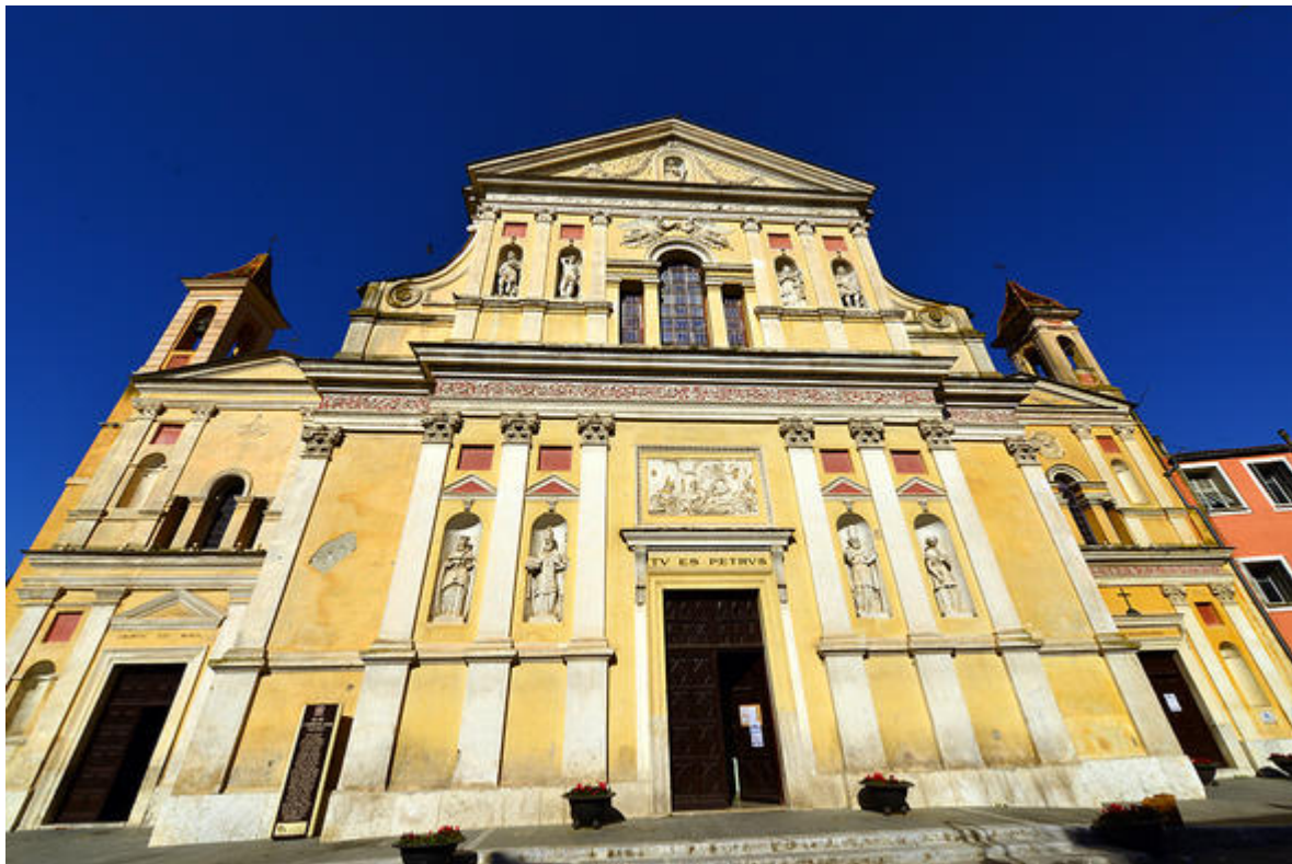
La chapelle des Noirs, la paroissiale, la chapelle des Blancs