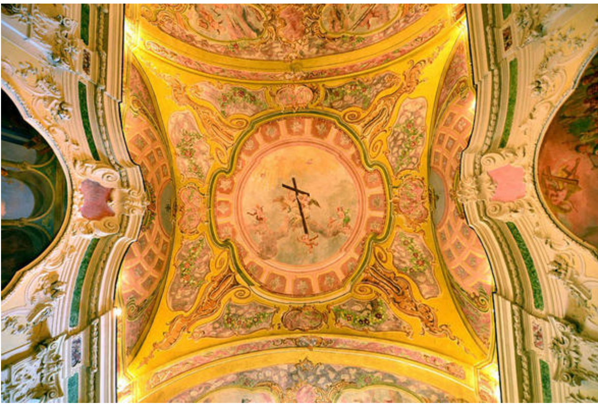
Décor du plafond des Pénitents blancs