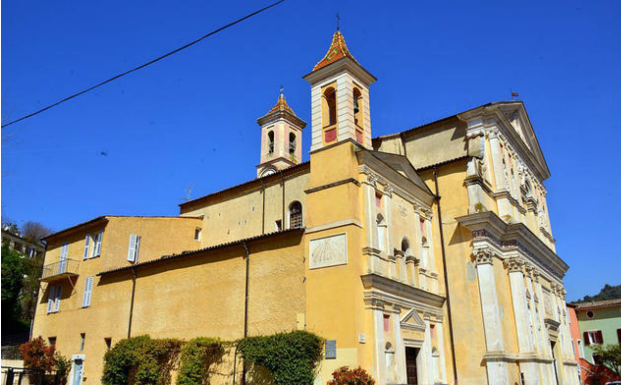
L'église Saint-Pierre vue de côté

Classée Monument historique, l'église se situe au cœur du vieux village de l'Escarène, une étape incontournable sur la route du sel jusqu'au XIX e siècle. L'édifice principal est flanqué de deux chapelles latérales, au nord celle des pénitents blancs, au sud celle des pénitents noirs. L'ensemble constitue un magnifique exemple de baroque nisso-ligure.