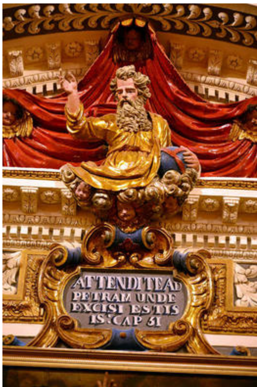
Détail du maître- autel de l'église