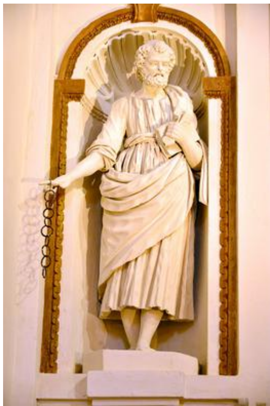
Statue de Saint-Pierre en façade