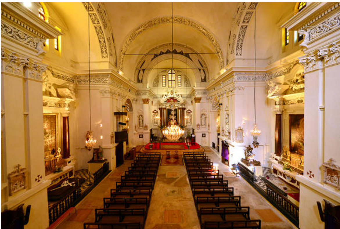
L'intérieur de l'église Saint-Pierre