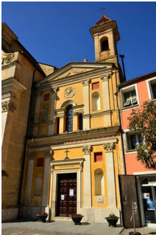
La façade de la chapelle des Pénitents noirs