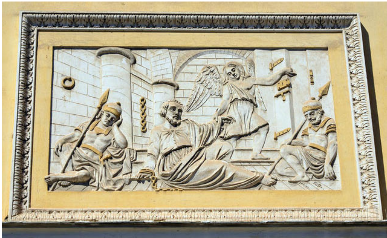
Bas-relief de la façade