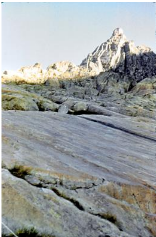
Le Mont des Merveilles