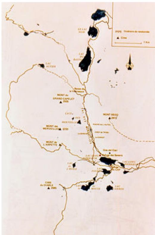
Carte des Merveilles