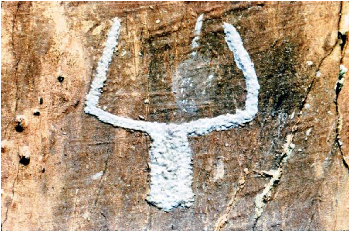
Gravure représentant un corniforme isolé