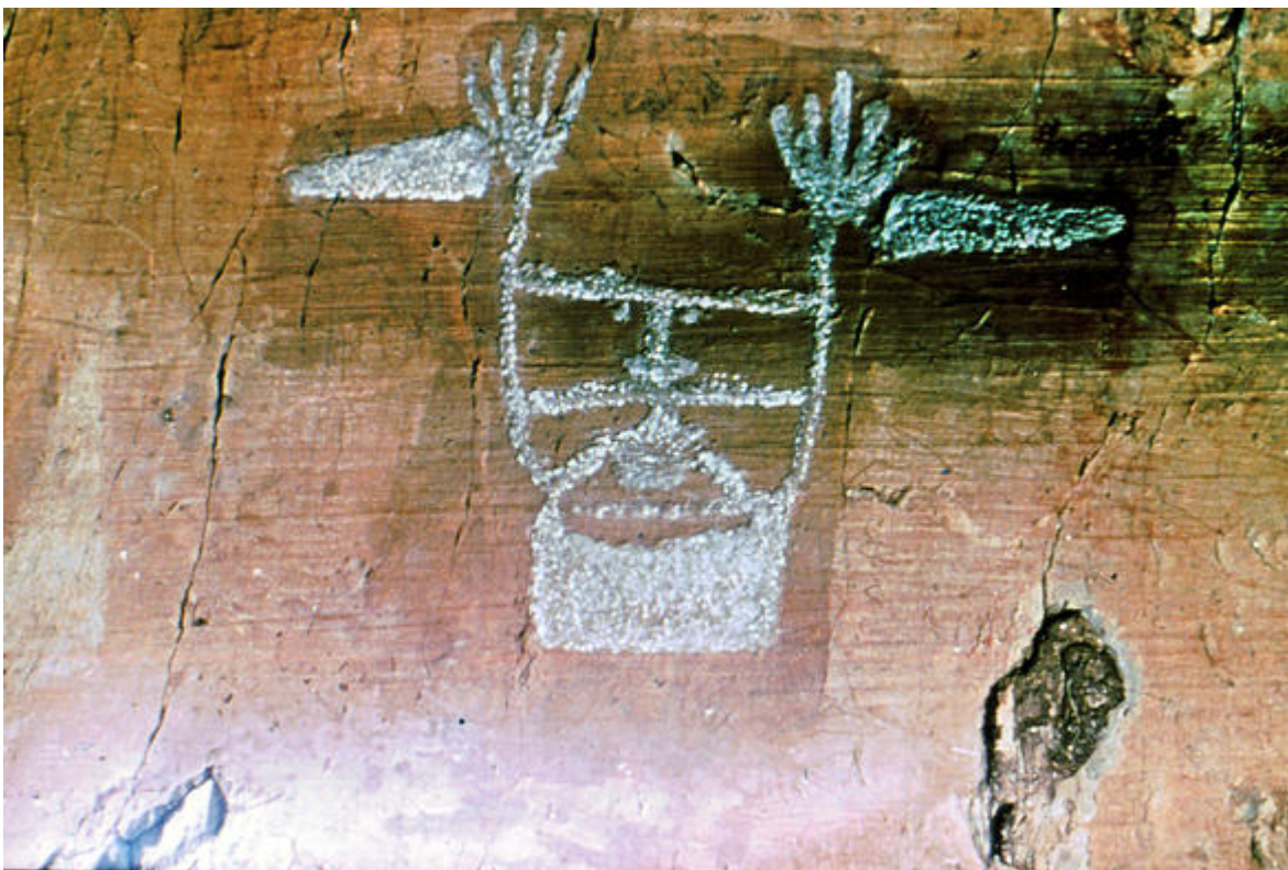
"Gravure du sorcier". Cette gravure est l'une des plus emblématiques de la vallée des Merveilles. Il s'agit vraisemblablement de la représentation du dieu orage.