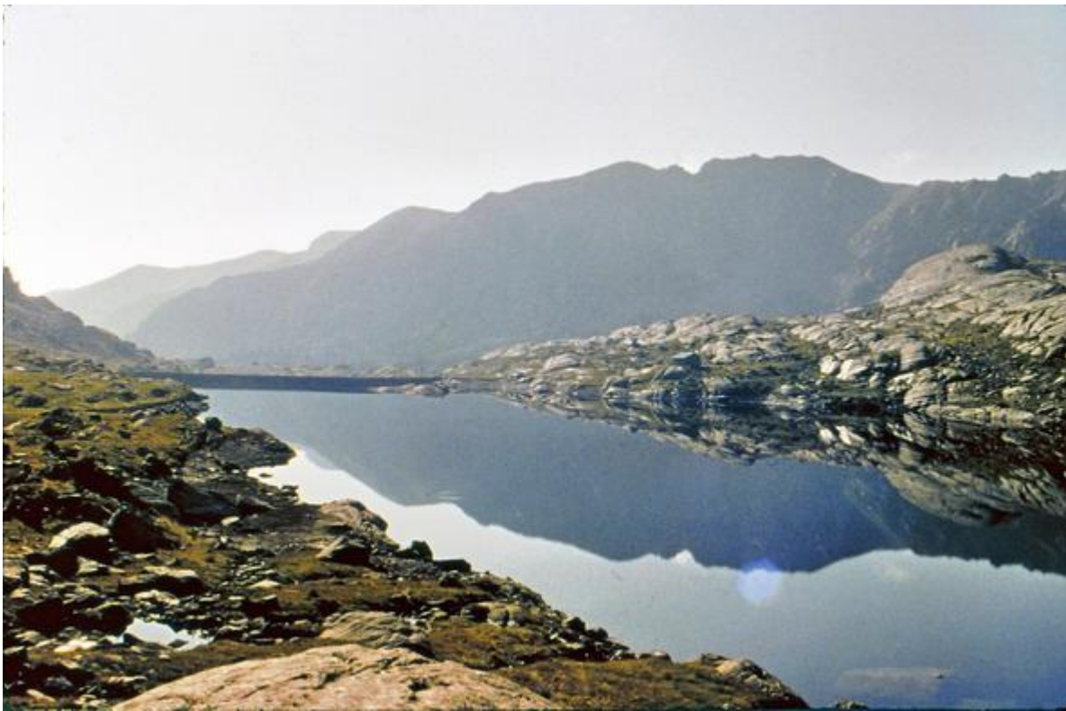
Le lac Long supérieur dans la Vallée des Merveilles