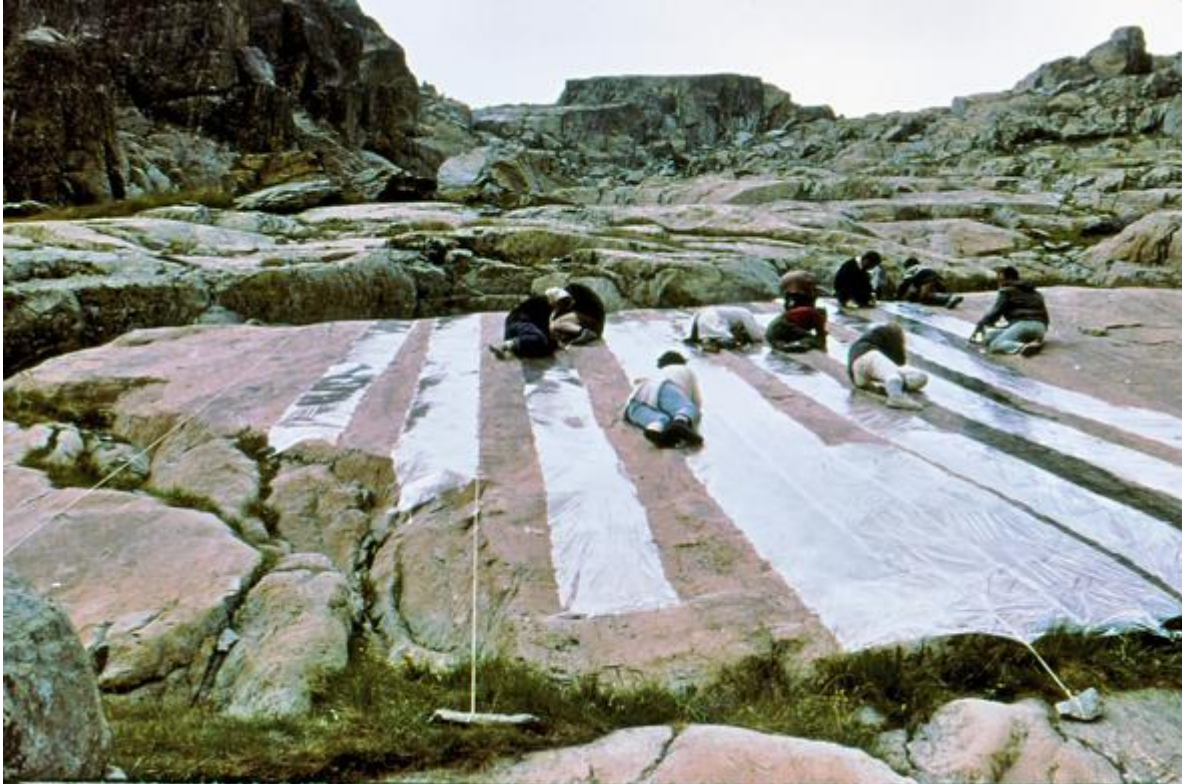
Relevé de gravures

Située à la frontière franco-italienne dans les Alpes-Maritimes, au cœur du Parc national du Mercantour, la « région du mont Bego » est un véritable musée à ciel ouvert qui s'étend sur environ 14 km 2 . Tout autour du mont Bego, qui culmine à 2 872 m, de hautes vallées montagnardes d'origine glaciaire conservent plus de 50 000 gravures disséminées sur les roches entre 2 000 et 2 700 m d'altitude.