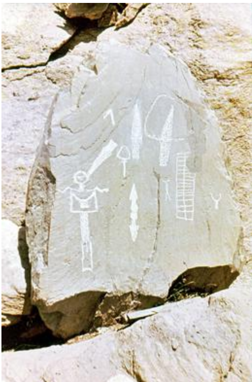
Gravure dite "du chef de tribu". Pour la préserver des dégradations, cette stèle fut déplacée en 1988 au musée de Tende et une copie a été disposée à sa place.