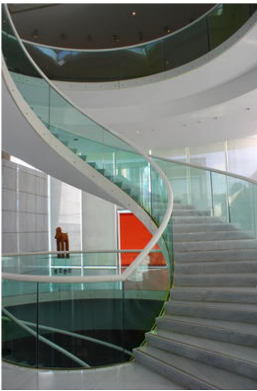
Intérieur du musée, vue de l'escalier