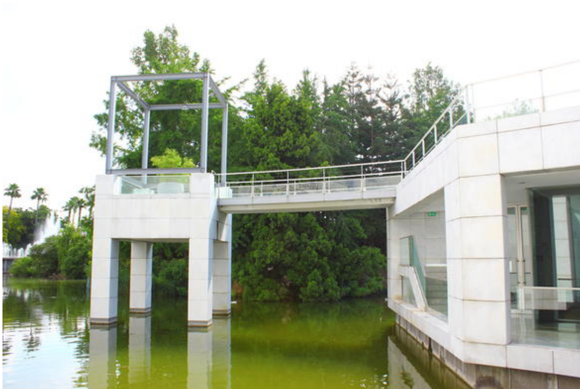
Vue extérieure du musée, élément d'architecture