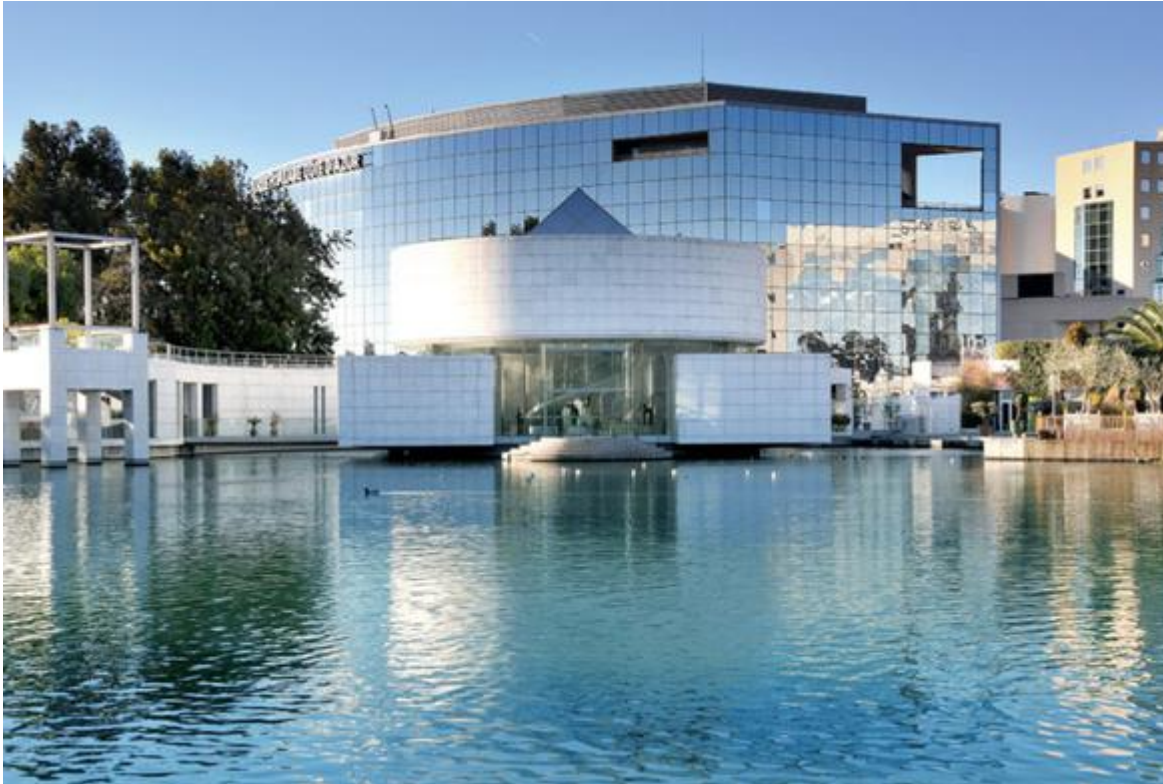
Vue du Musée des Arts Asiatiques depuis le parc Phoenix

Réalisé par le célèbre architecte japonais Kenzo Tange, le Musée des Arts Asiatiques de Nice se veut être un lieu d'échanges et de dialogues entre les arts asiatiques et la culture occidentale. Le musée s'articule autour de quatre espaces présentant des œuvres remarquables des civilisations chinoise, japonaise, cambodgienne et indienne.