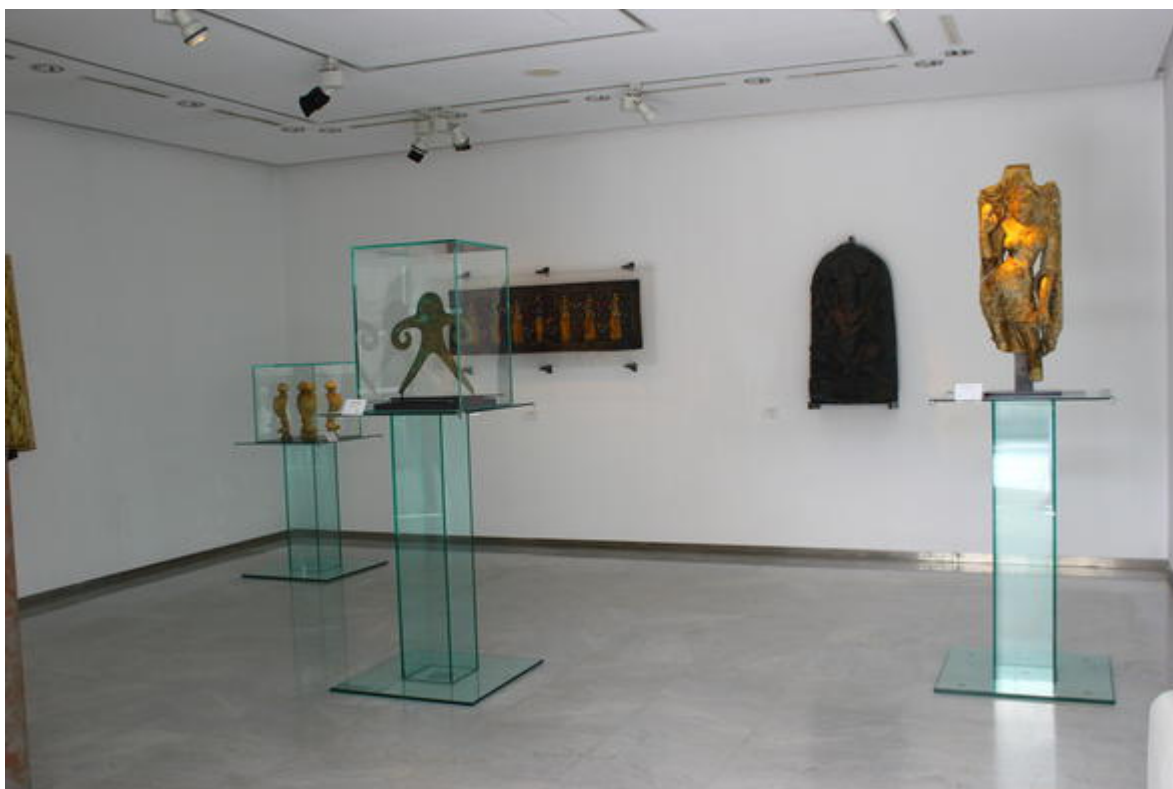
Salle d'exposition du musée, ( collection Art Indien)