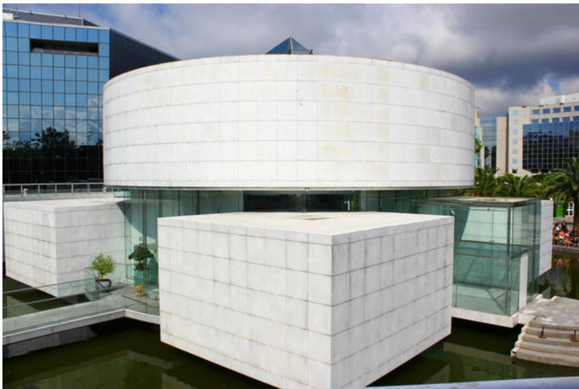
Vue extérieure du musée depuis la terrasse