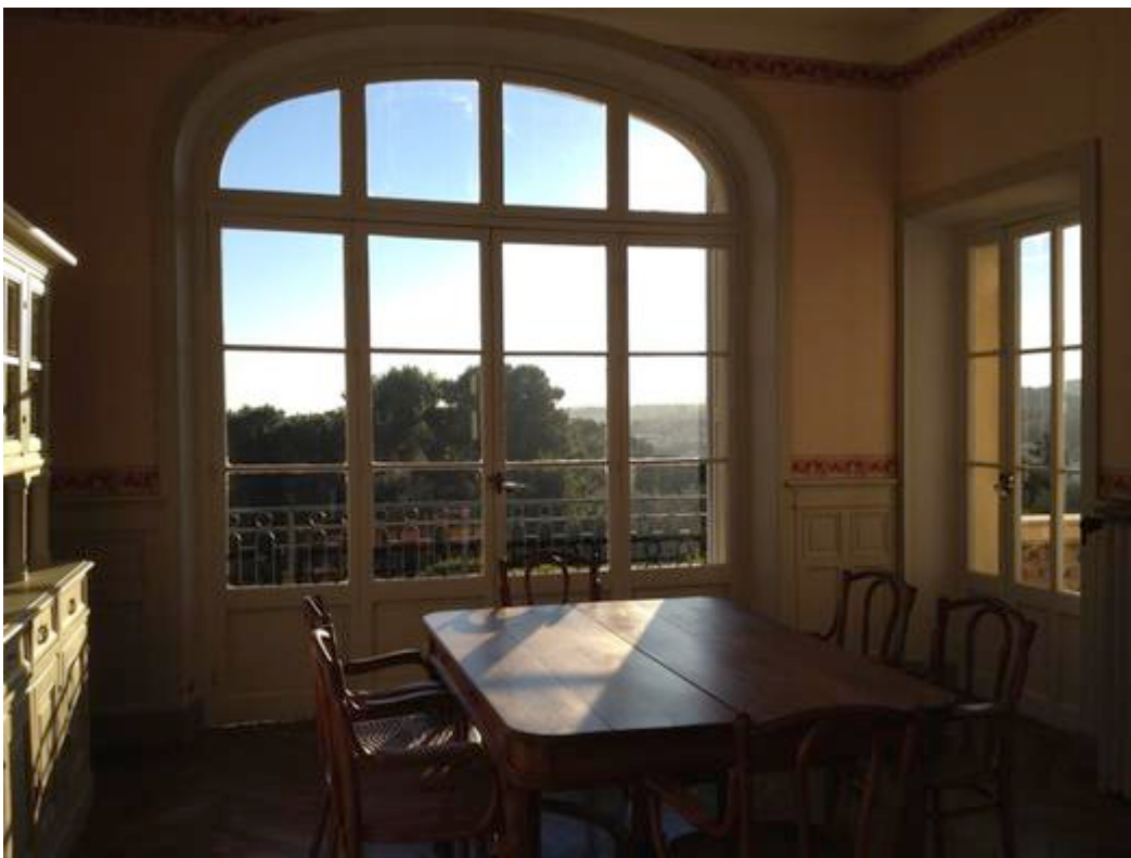
Vue de l'intérieur de la maison des Collettes