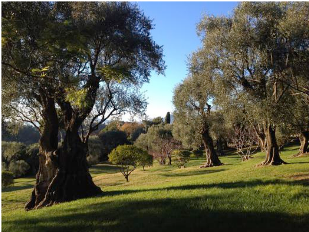
Le jardin des Collettes, l'olivieraie