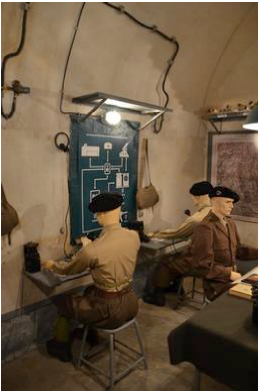
Fort Saint-Roch à Sospel : poste de commandement