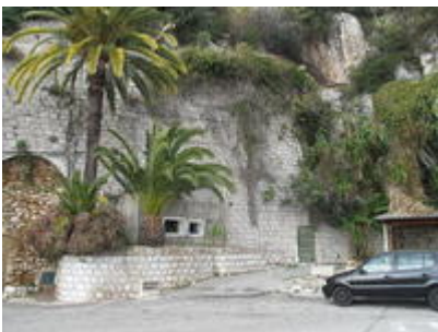
Ouvrage du pont Saint-Louis à Menton

En ce qui concerne la ligne Maginot des Alpes, le Secteur Fortifié des Alpes Maritimes (SFAM) prend en charge la construction de fortifications depuis le col de la Bonette jusqu'à la Méditerranée en s'étirant le long des vallées de la Tinée, de