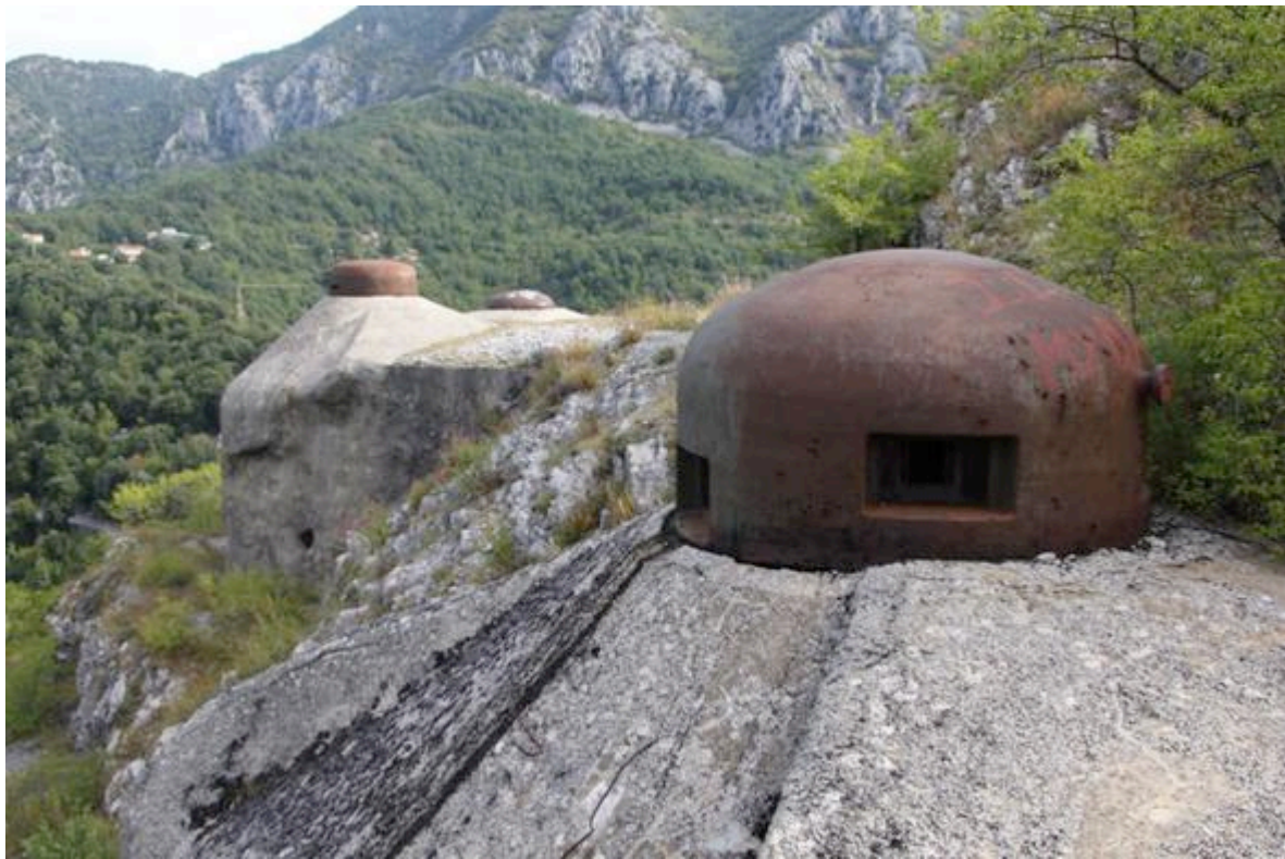
Fort de Castillon : blocs de combat avec cloches blindées pour fusils mitrailleurs