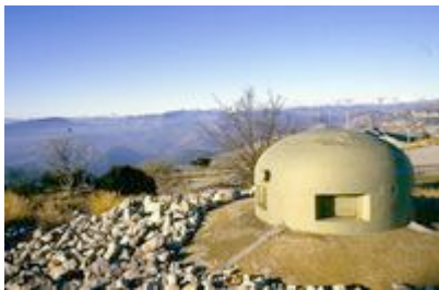
Fort du Mont Agel, Bloc cuirassé de défense des dessus

Hormis les deux forts du Barbonnet et du Mont Agel datant de la fin du XIX ème siècle, modernisés avec l'adjonction de blocs d'artillerie performants, les autres gros ouvrages sont tous construits ex nihilo . Le dispositif est complété par de petits ouvrages tel que celui du col des Banquettes au dessus de Peille, ceux de la Béole et de la Baisse de Saint-Véran situés en altitude sur la commune de Breil-sur-Roya ou encore celui de la Croupe du réservoir à Roquebrune-Cap-Martin. L'ensemble architectural compte également les avant-postes typiques de la ligne Maginot comme ceux de Fressinéa, le long du Var à Rimplas, du col des Fourches sur la route qui relie Saint-Etienne de Tinée au col de la Bonette, du col de Raus dominant à plus de 2000 mètres d'altitude la stratégique vallée du Caïros, de la Pierre Pointue à Sospel, du village d'Isola ou encore celui du Pont Saint-Louis en contrebas des douanes à Menton.