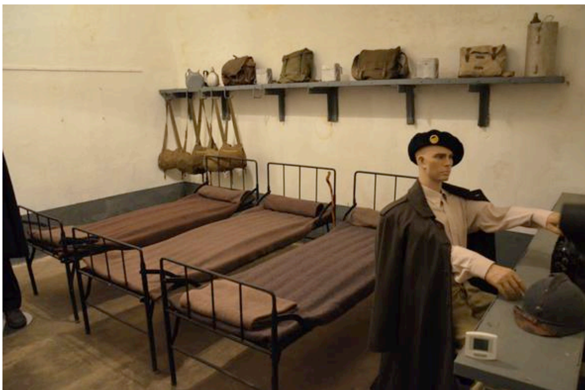
Fort Saint-Roch à Sospel : chambrée des hommes