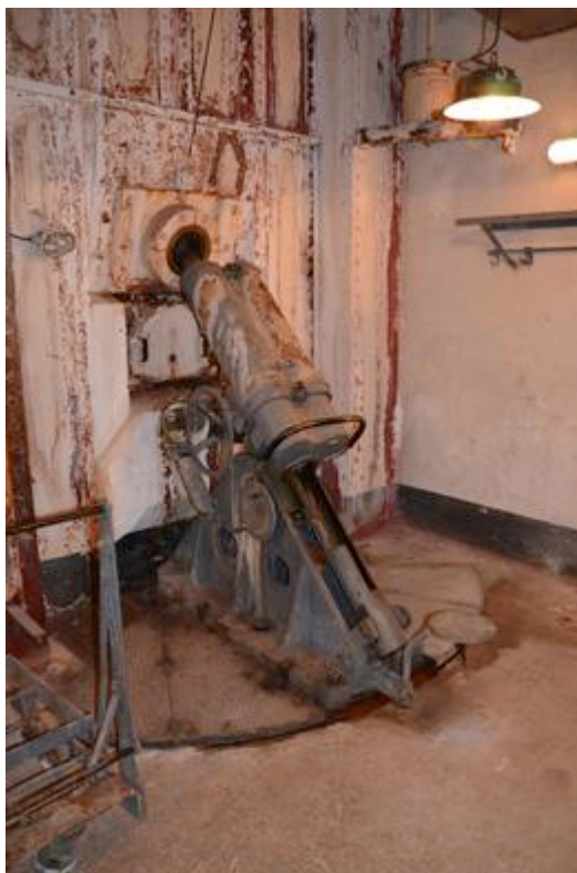
Fort Saint-Roch à Sospel : mortier de 81 mm dans le bloc de combat