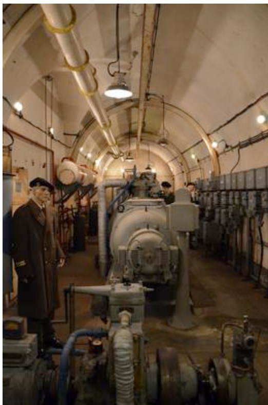
Fort Saint-Roch à Sospel : usine électrique