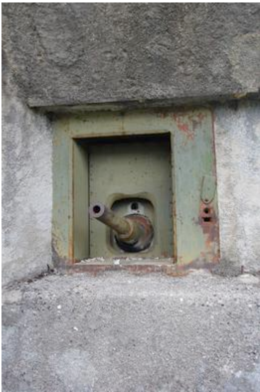
Fort de Castillon : embrasure avec obusier de 75 mm