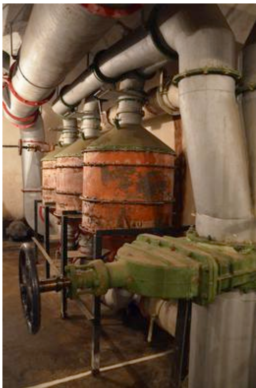
Fort Saint-Roch à Sospel : installation de filtration de l'air