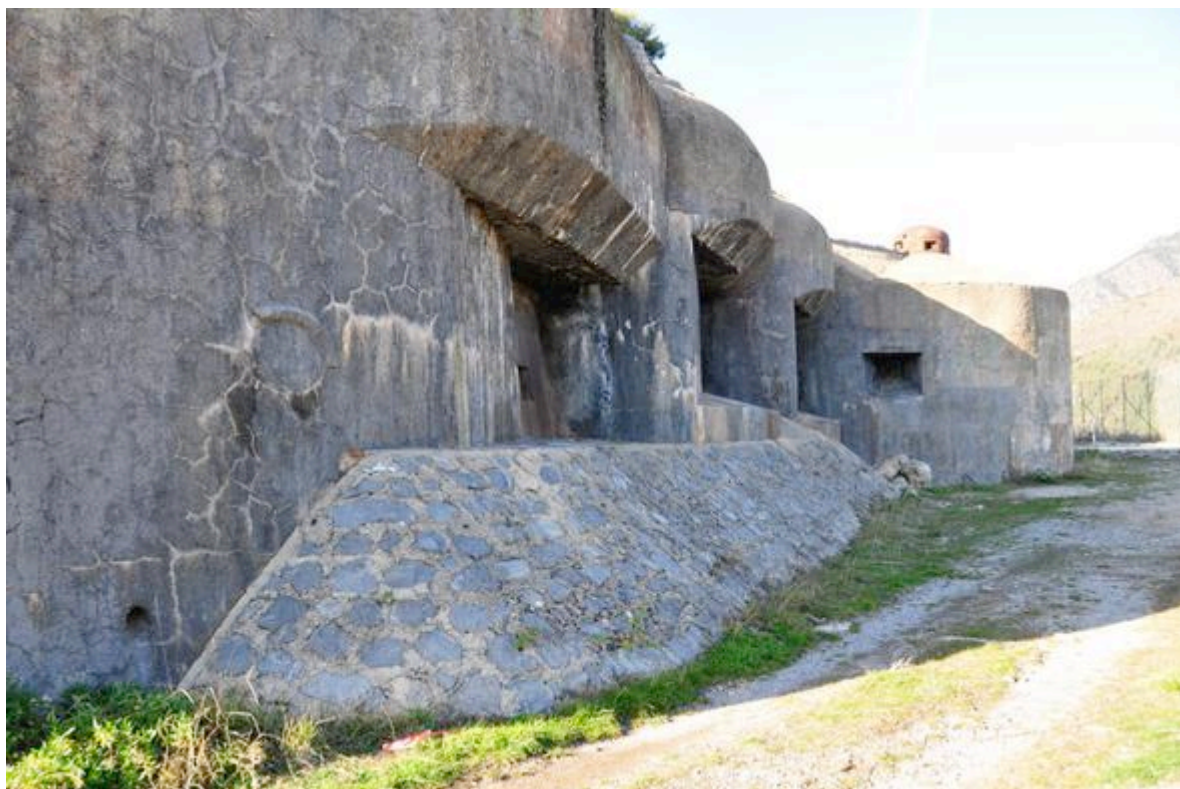
Fort de Rimplas : blocs de combat

Quelques années après du dispositif de fortifications « Séré de Rivières » (lire la fiche correspondante), les Alpes Maritimes voient la construction de la ligne Maginot.. La richesse de cet ensemble patrimonial montre à quel point la frontière a pu faire l'objet, à différentes périodes, d'une forte mobilisation traduite par un équipement solide et une surveillance inquiète.