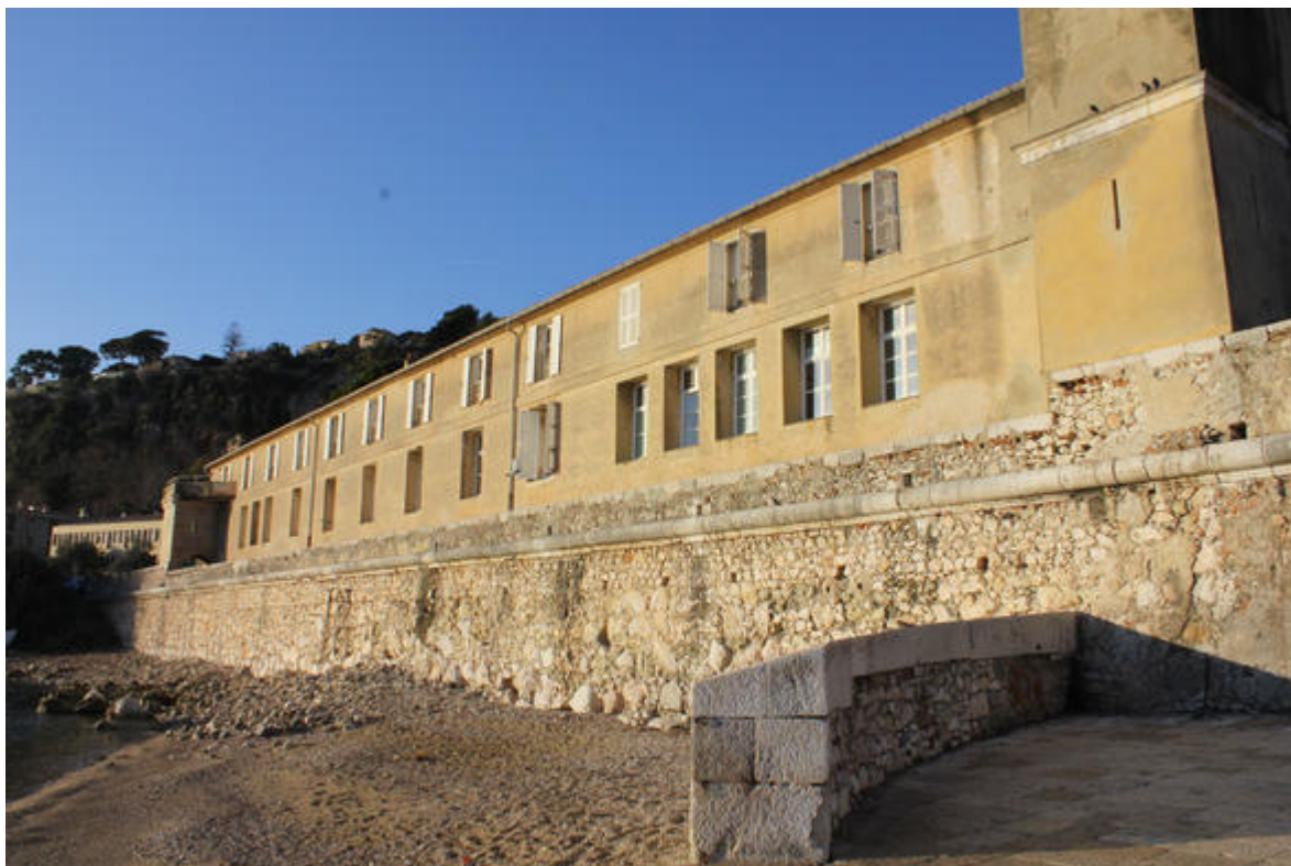
Les « Galériens », une ancienne prison, est l'un des deux bâtiments constituant la Station Zoologique de l'O.O.V.