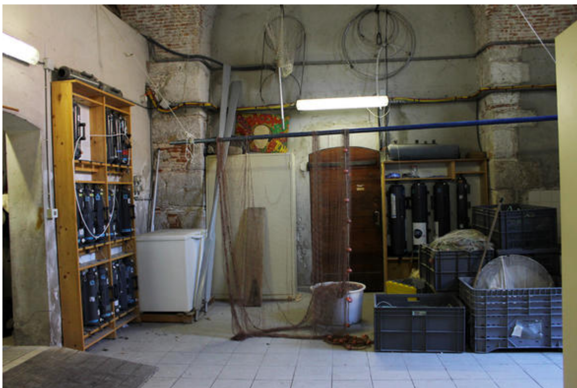
Stockage d'équipement pour le prélèvement de plancton .