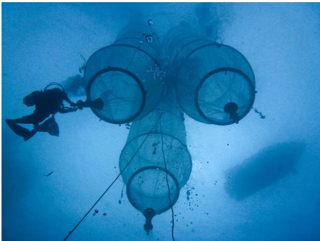
Vue sous-marine d'un ensemble de 3 mésocosmes. Ceux-ci sont des sacs qui permettent d'isoler 50m 3 d'eau de mer et ainsi simuler différentes conditions environnementales.