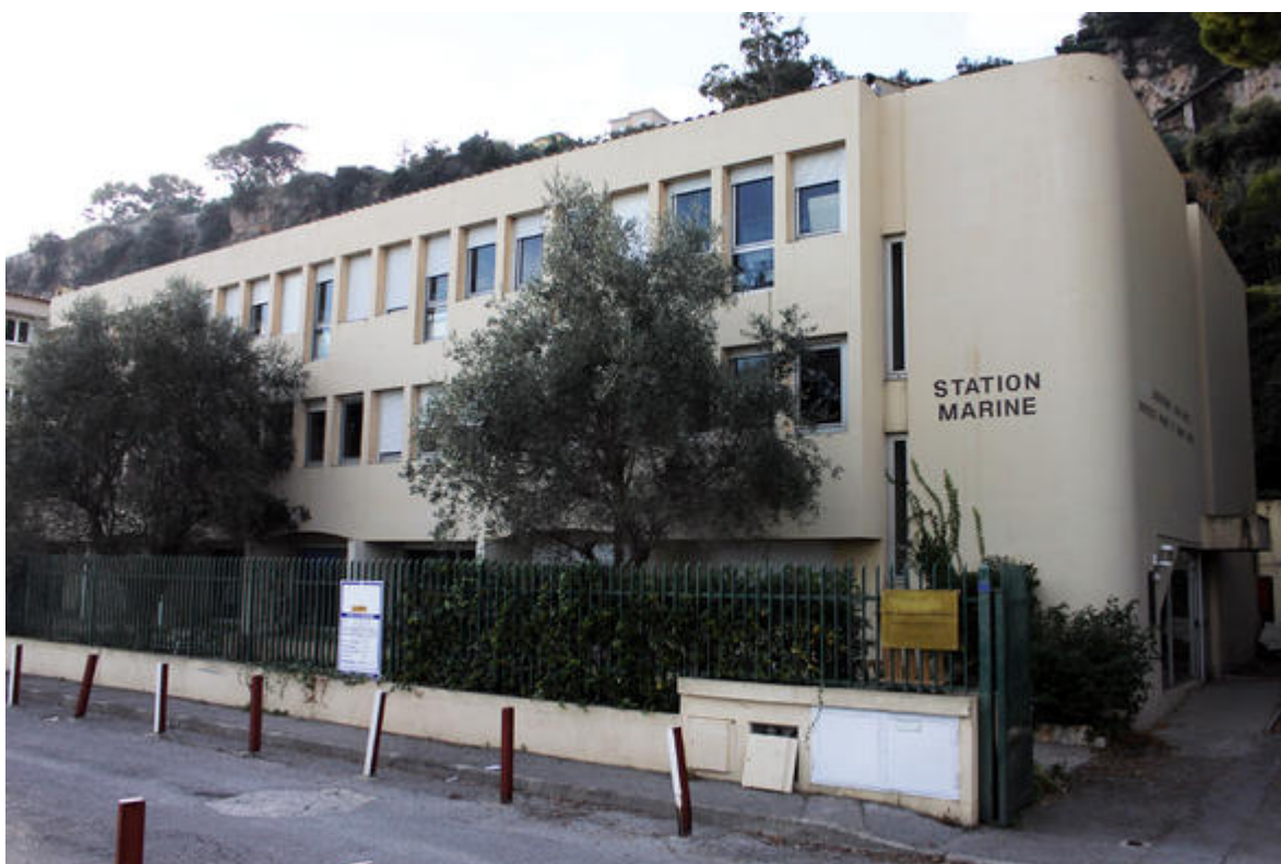
Le bâtiment Jean Maetz, le plus récent des immeubles occupés par le personnel de l'O.O.V.