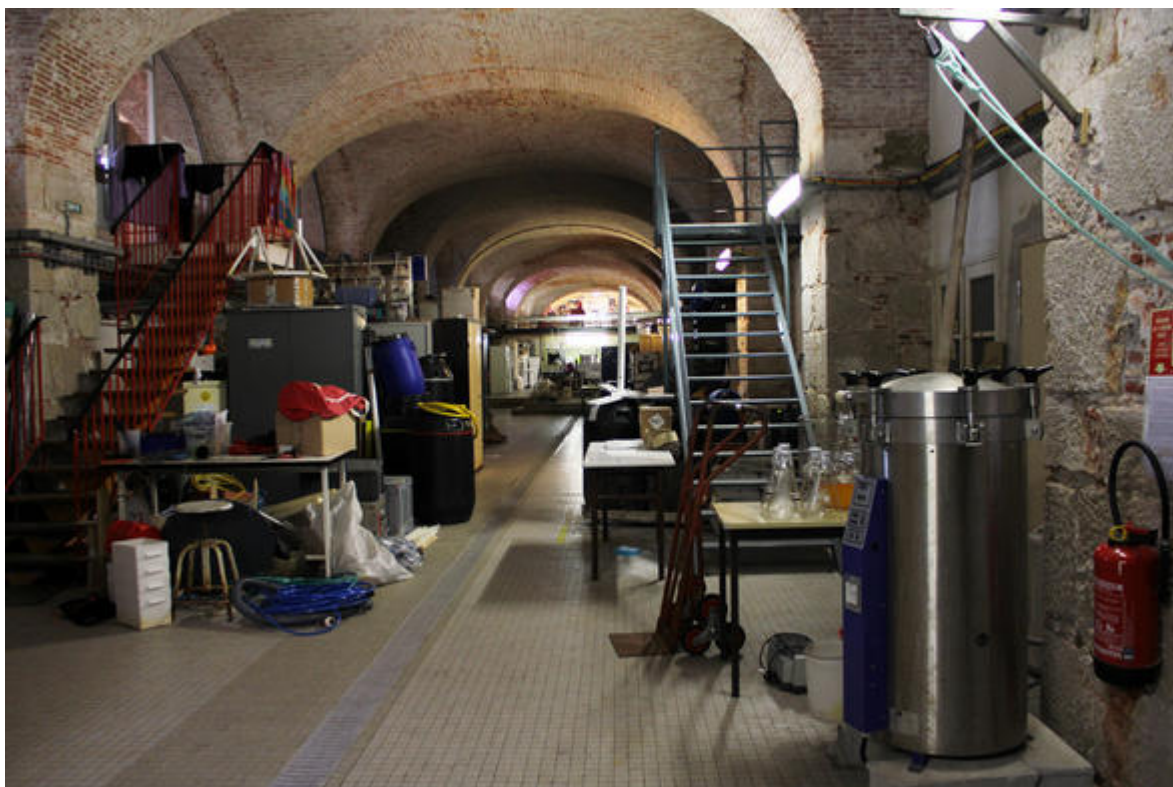
De nombreux laboratoires de l'OOV se trouvent à niveau des anciennes voûtes du bâtiment des « Galériens ». Ce magnifique espace abrite appareils et instruments de tout genre.