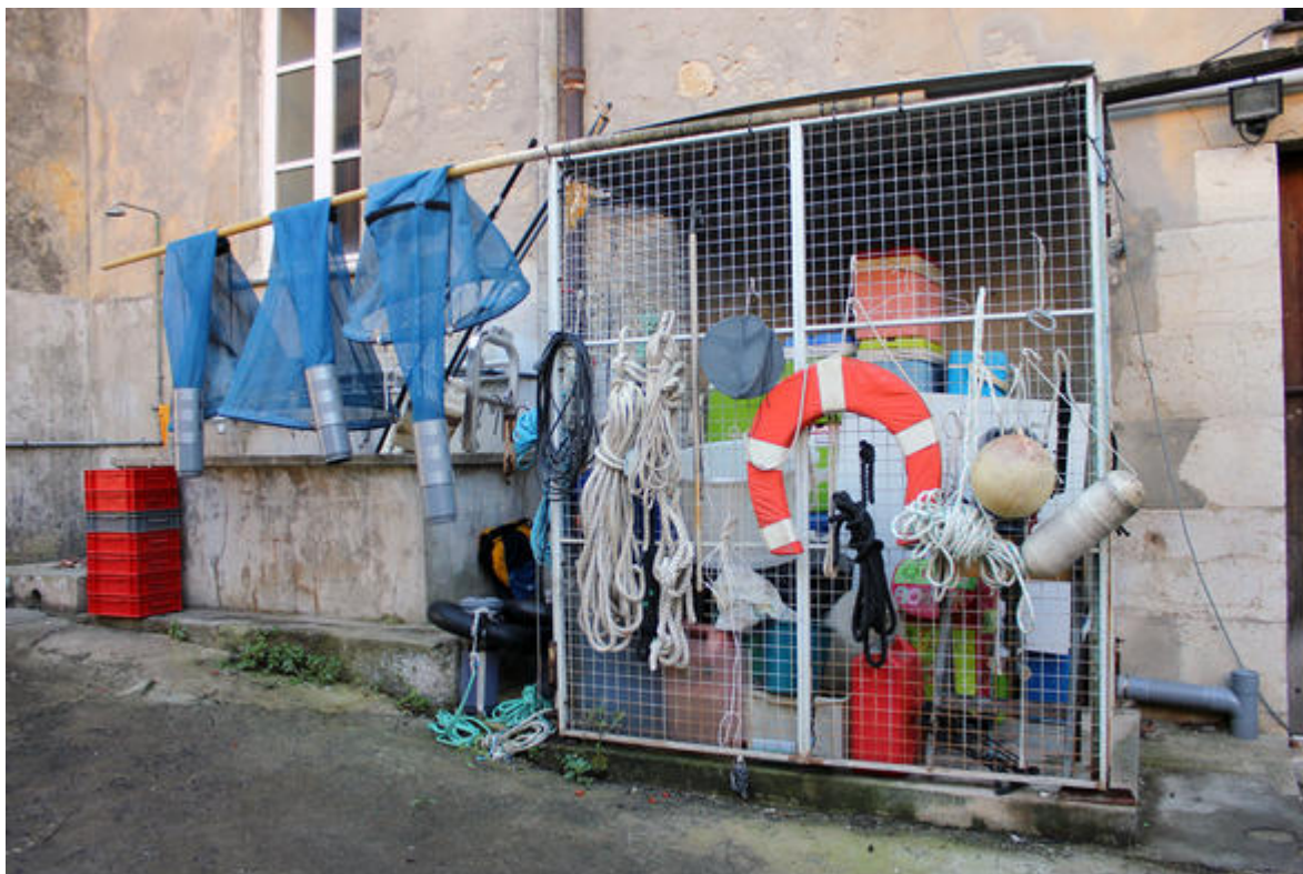
Stockage d'équipement pour la plongée et la pêche de larves de poissons.